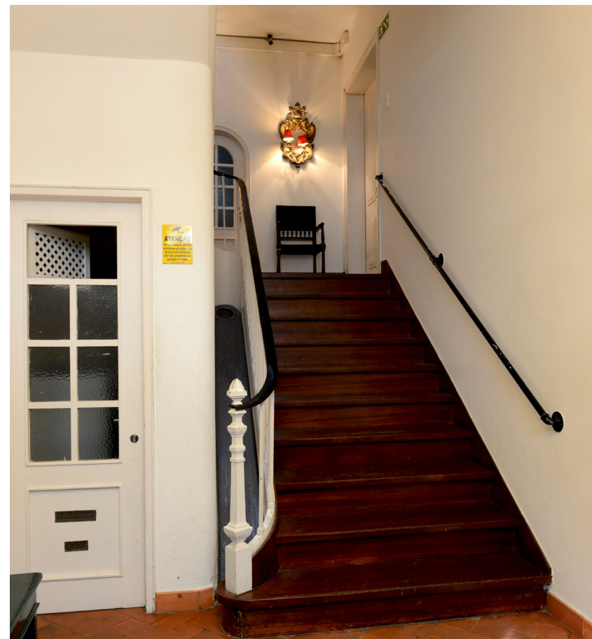
Escada de acesso às instalações do SNMCR com entrada pelo nº 57 da R. dos Douradores.