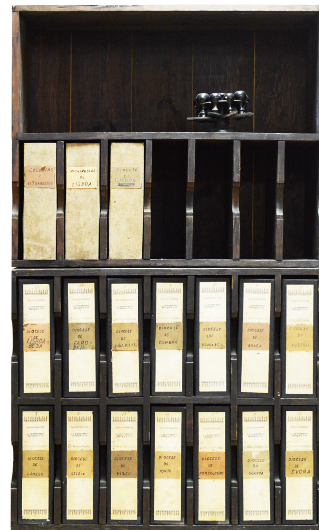
Estante construída por encomenda do SNMCR, feita à medida para conter as pastas da série PT-SCR/SNMCR/B/05 - Correspondência recebida das dioceses.

ao escasso tempo decorrido desde a sua produção, a documentação é para uso exclusivo dos serviços do Santuário.