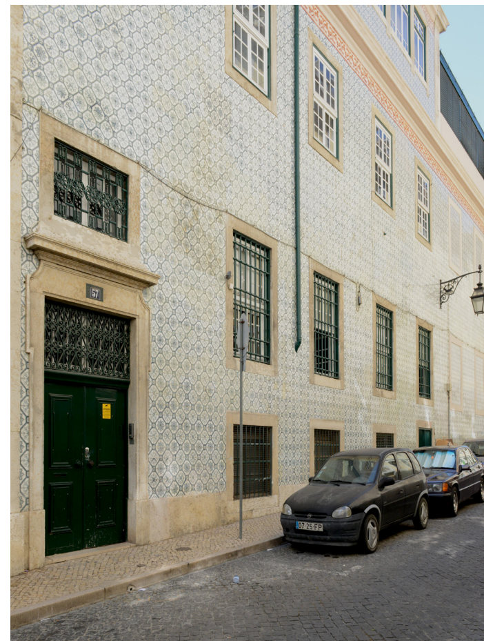
Porta da entrada e janelas das instalações do SNMCR no lado esquerdo da Igreja de S. Nicolau, dando para a R. dos Douradores.