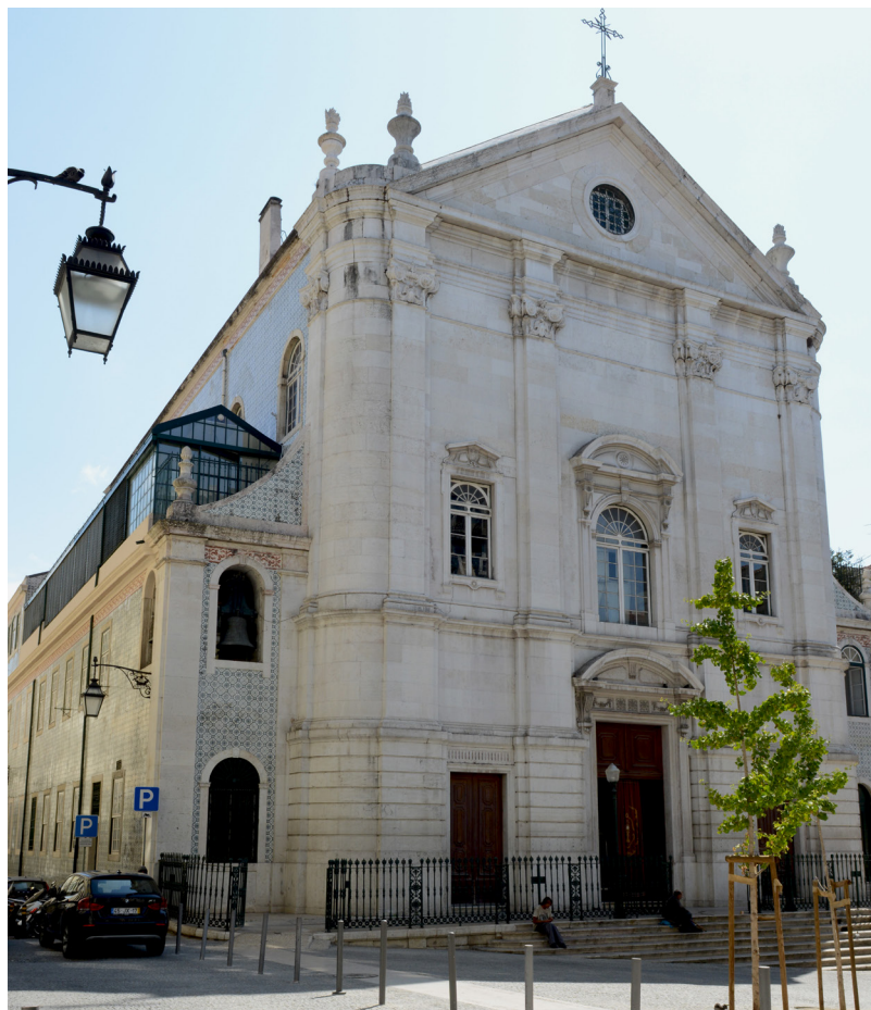
Igreja de S. Nicolau (Lisboa), em cujas dependências funcionou o Secretariado Nacional do Monumento a Cristo Rei.