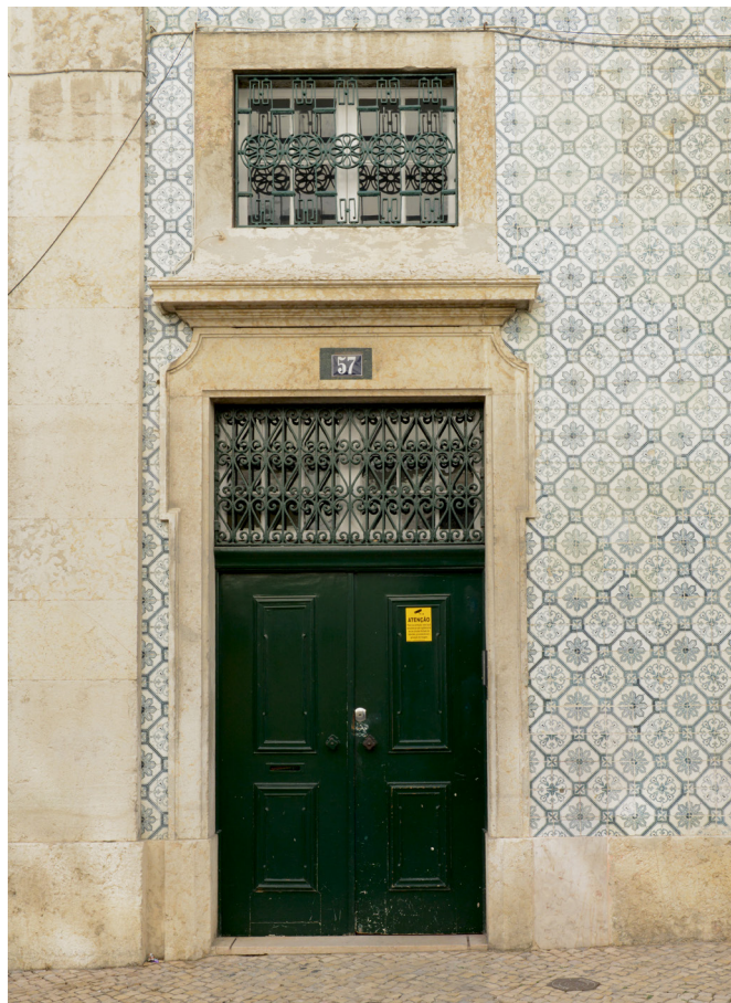
Porta de entrada das instalações do SNMCR no nº 57 da R. dos Douradores.