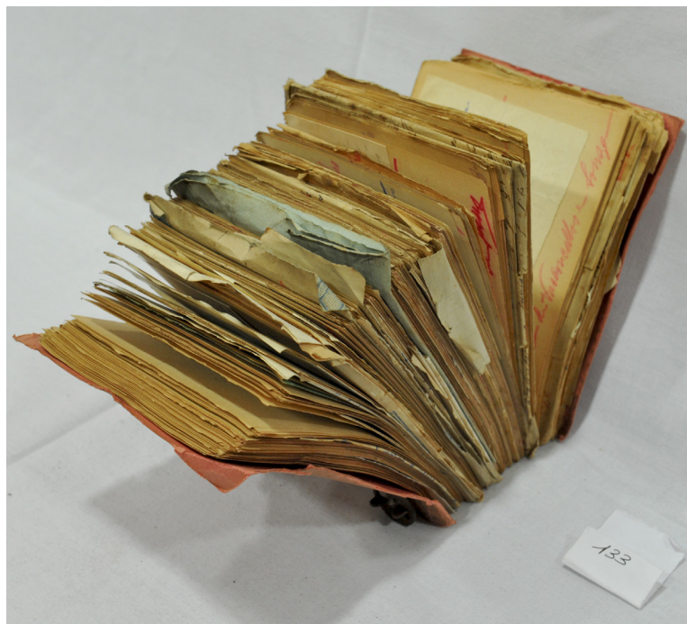
Aspecto de um maço da série PT-SCR/SNMCR/C/01 - Cópias de recibos, sendo visíveis os diferentes tipos de documentos pois as cópias de recibos tinham junto anexos de diferentes formatos.