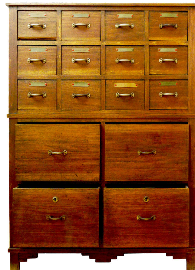
Armário construído por encomenda do SNMCR para conter as fichas da série PT-SCR/SNMCR/B/08 - Ficheiro da subscrição geral.

Sistema de organização: Ordenação cronológica.