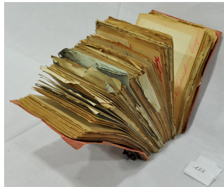
Um dos maços com os recibos que integram a série PT-SCR/SNMCR/C/01 - Cópias de recibos, sendo visíveis os diferentes tipos de documentos.

Âmbito e conteúdo: Integra um livro para servir de copiador da correspondência expedida, o qual não foi usado. Tem carimbos da Repartição de Finanças.