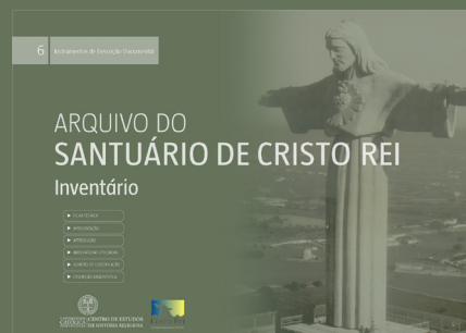
6. INVENTÁRIO DO ARQUIVO DO SANTUÁRIO DE CRISTO REI Paulo Gonçalves