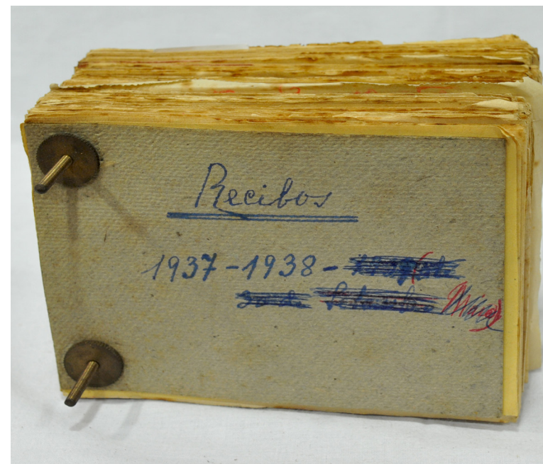
Um dos maços com os recibos que integram a série PT-SCR/SNMCR/C/01 - Cópias de recibos.