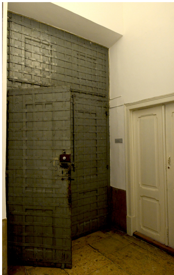
Vista do patamar que dava acesso à sala onde esteve instalado o SNMCR, porta do lado direito, assim como à sala que serviu de escritório aos engenheiros entre 1950 e 1960, porta do lado esquerdo.