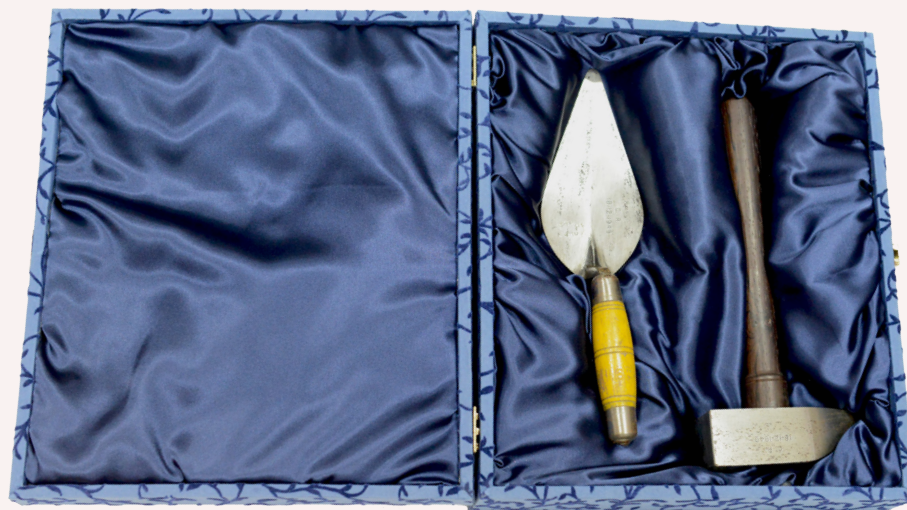
Pá e martelo, dentro da respetiva caixa, que foram usados na cerimónia da bênção da primeira pedra do Monumento a Cristo Rei.