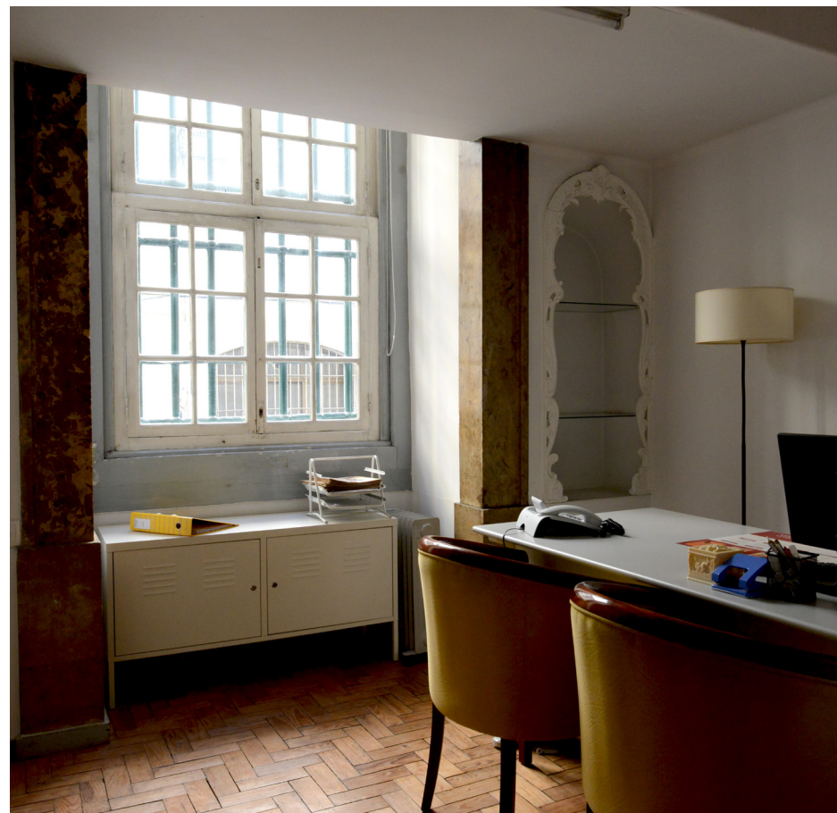
Aspecto atual da sala onde funcionou o SNMCR.