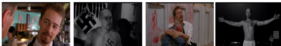
Figura 2 - América Proibida (1998) de Tony Kaye

No entanto, a verdade é que, pontualmente e, em perfeito desalinho com o aqui escrito, alguns filmes invertem o significado dos símbolos produtores do efeito de lembrança e, nestes casos esporádicos, o preto e branco passa a representar o presente e a cor o passado.