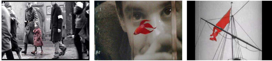
Figura 9 - A Lista de Schindler (1993) de Steven Spielberg, Rumble Fish (1983) de Francis Ford Coppola e O Couraçado de Potemkin (1925) de Sergei Eisenstein

Sumariamente, e pela análise dos exemplos apresentados, podemos afirmar que estamos perante incursões cromáticas, pontuações visuais ou, se quisermos, fenómenos diegéticos uma vez que, em rigor, em qualquer um dos três anteriores exemplos citados, a cor penetra na diegese do preto e branco. Tal acontece objetivando as mais variadas funções, sejam elas puramente estilísticas ou, por outro lado, uma pertinente forma de, por via da cor, evidenciar um determinado elemento da imagem, seja ele um objeto, uma personagem ou uma parte do ambiente cenográfico.