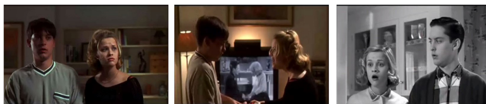
Figura 6 - Pleasantville - A Vida em Preto e Branco (1998) de Gary Ross

Em sentido claramente inverso, em Pleasantville - A Vida a Preto e Branco (1998) de Gary Ross, é a utilização do preto e branco e não da cor que remete o espectador para um “novo mundo”. Um mundo que não é “real”, porque esse é desde logo apresentado a cores, mas um mundo ideal, imagético e ficcional apresentado a preto e branco. Pleasantville - A Vida a Preto em Branco apresenta-nos a vida de dois gémeos com características bem distintas que um dia, como que por magia, são sugados pela televisão e tornam-se personagens reais da série a preto e branco Pleasantville. Abandonam o mundo da cor e passam a integrar o mundo do preto e branco, o mundo de Pleasantville. Também neste exemplo o preto e branco está associado à criação de novos mundos, numa clara motivação de distanciamento do mundo “real” e ao fornecer uma possibilidade de interferência formal entre os dois.