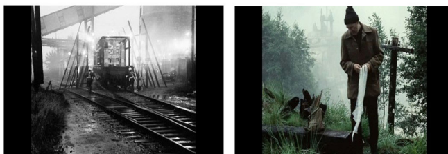
Figura 7 - Stalker (1979) de Andrei Tarkovsky

história de uma suposta queda de meteoritos numa região do planeta que adquire propriedades estranhas e é, curiosamente, chamada de Zona . “A Zona é uma zona, é a vida, e, ao longo dela, um homem pode-se destruir ou pode-se salvar. Se ele se salva ou não, é algo que depende do seu próprio autorrespeito e da sua capacidade de distinguir entre o que realmente importa e o que é puramente efêmero.” (Tarkovsky 1998, 241). Dentro da Zona , existe um local onde todos os desejos são realizados, “os personagens do filme empreendem a sua viagem rumo à Zona , seu destino é uma determinada sala na qual, segundo dizem, o desejo mais íntimo de qualquer pessoa será realizado.” (Tarkovsky 1998, 238) é o chamado Quarto onde apenas alguns poucos, os chamados Stalkers conseguem entrar e sobreviver lá dentro. Em Stalker , a diferenciação de ambientes pela cor e pelo preto e branco, mais do que colocá-los em confronto ou oposição conferem-lhes um clima de notável e muito instigante tensão criativa.