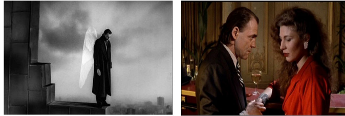
Figura 8 - As Asas do Desejo (1987) de Wim Wenders

e branco para a cor, com a passagem de Daniel do estado de anjo para humano, concretiza-se simbolicamente na fronteira entre a Alemanha Oriental e a Alemanha Ocidental, conferindo também por este facto um significado de cariz político à dialética da cor e do preto e branco num contraponto entre o cinzento austero de Berlim Oriental e o pluralismo de cores da democracia ocidental, patentes no grafitado muro que na altura dividia a cidade física e emocionalmente. “Berlim é um lugar histórico da verdade. Nenhuma outra cidade é tanto um símbolo, tão lugar de sobrevivência, tão exemplar do nosso século. Berlim está tão dividida como o nosso mundo, como o nosso tempo, como homens e mulheres, como jovens e velhos, como pobres e ricos, como cada uma das nossas experiências.” (Wenders1 2010, 115)