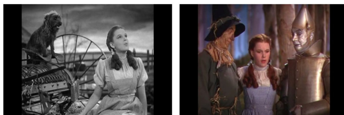
Figura 5 - O Feiticeiro de Oz (1939) de Victor Fleming

Em sentido claramente inverso, em Pleasantville - A Vida a Preto e Branco (1998) de Gary Ross, é a utilização do preto e branco e não da cor que remete o espectador para um “novo mundo”. Um mundo que não é “real”, porque esse é desde logo apresentado a cores, mas um mundo ideal, imagético e ficcional apresentado a preto e branco. Pleasantville - A Vida a Preto em Branco apresenta-nos a vida de dois gémeos com características bem distintas que um dia, como que por magia, são sugados pela televisão e tornam-se personagens reais da série a preto e branco Pleasantville. Abandonam o mundo da cor e passam a integrar o mundo do preto e branco, o mundo de Pleasantville. Também neste exemplo o preto e branco está associado à criação de novos mundos, numa clara motivação de distanciamento do mundo “real” e ao fornecer uma possibilidade de interferência formal entre os dois.