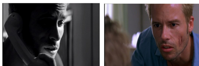
Figura 4 - Memento (2000) de Christopher Nolan

Memento (2000) de Christopher Nolan é uma verdadeira lição de como gerir o fator tempo numa narrativa fílmica. Memento apresenta uma muito complexa relação mútua e reciprocamente construtiva do passado, do presente e do futuro. Ao longo do filme o passado vai sendo constantemente reinterpretado pelo tempo presente conduzindo a sempre novas projeções do futuro num verdadeiro jogo de horizontes temporais díspares. Memento narra a história de Leonard (Guy Pearce), um investigador de seguros com um grave problema de memória devido a um traumatismo aquando do assassinato da sua mulher. Obcecado por vingança, a vida de Leonard resume-se no tempo presente, a uma procura pelo assassino através de uma construção em retrocesso de uma lógica sequência causal. Um verdadeiro quebra-cabeças para o espectador que, no entanto, com a ajuda do preto e branco e da cor na delimitação das narrativas consegue, com alguma atenção e perspicácia, identificar uma lógica cronológica através das sequências a preto e branco e uma ordem reversa através das sequências a cores.