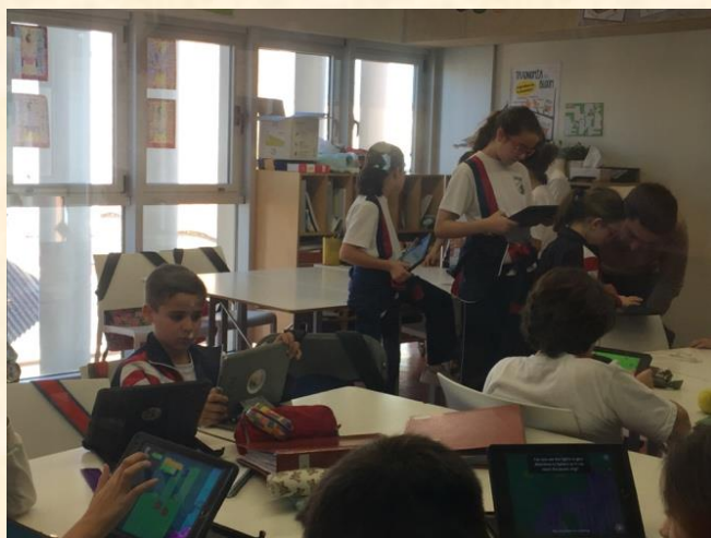
Imagem 5 – Aula de robótica