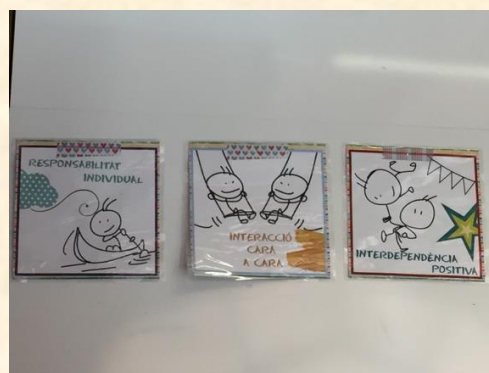
Imagem 2 – Parede de um espaço de aprendizagem

Há, portanto, um ethos institucional positivo e promotor de relações profissionais competentes, próximas e empáticas, onde muitas vezes a docência é partilhada, visto que os alunos, regra geral, trabalham num espaço amplo, em grupo (máximo 3 alunos), por projetos interdisciplinares, predominando o trabalho em equipa, a entreaajuda, a pesquisa orientada e a produção de conhecimento a partir de