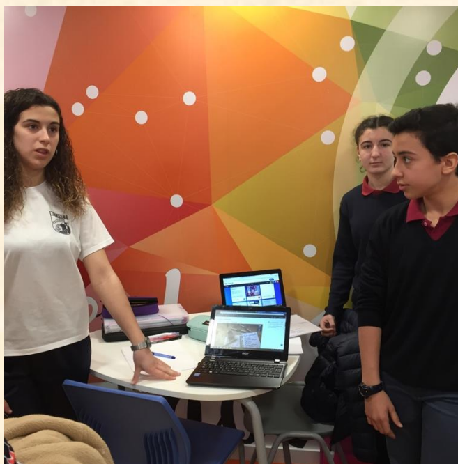
Imagem 6 – Apresentação de um projeto interdisciplinar

No que diz respeito à estratégia adotada para a avaliação das aprendizagens, salienta-se a pluralidade de critérios simples, claros e perceptíveis por todos, incluindo os alunos. Há uma aposta forte na modalidade formativa, onde o recurso ao feedback processual e a autoavaliação são privilegiados, não descurando várias estratégias e recursos: rubricas, portfólios, visual thinking , classe invertida, resolução de problemas da vida diária, steps , entre outros. No final, e em conselho de docentes, cada professor “especialista” - da área do saber específico - avalia e partilha os seus critérios com os