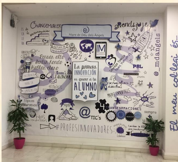
Imagem 1 – átrio de um dos edifícios de aprendizagem

Foi particularmente curioso e interessante presenciar a clareza e a vitalidade da diretora na apresentação sucinta deste percurso de inovação e mudança. Nas suas palavras, “se não se preparar os professores, investindo na formação, não vale a pena derrubar paredes...”. Foi também isto que foi confirmado. Apesar de alguns espaços estarem adequados a esta nova identidade, existiam outros, menos ajustados, mas que não obstaculizaram a implementação da referida transformação. Esta instituição educativa engloba três edifícios separados fisicamente mas onde o sentido de pertença ao mesmo projeto, à mesma visão e à mesma missão é claramente perceptível no modo de estar dos colaboradores, pelo modo de aprender e viver dos alunos e pelas marcas, símbolos, imagens, recursos, mensagens que se encontram nos espaços, contrariando a ideia de que mais é menos e que o excesso provoca ruído (visual). Aqui tudo tem significado(s); tudo alerta para o essencial; tudo serve para (re)lembrar o que os une!