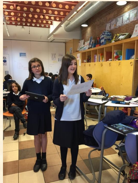
Imagem 4 – Alunas da Educació Primària a explicitar a pesquisa realizada sobre a União Europeia.