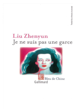
(versão francesa da capa do livro)