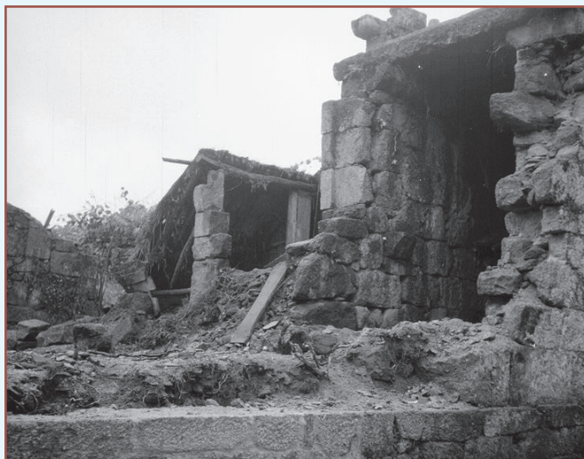
Quinta da Torre - ruínas (1955)