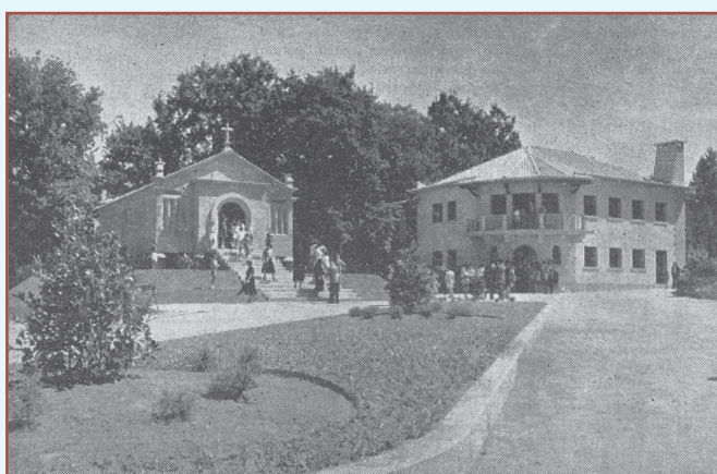
Cruzeiro e entrada do Calvário (1957)