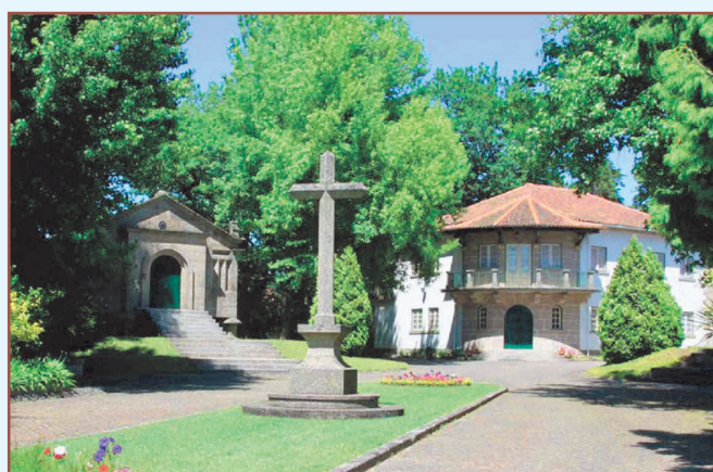
Cruzeiro e entrada do Calvário (2018)

Rumemos a Beire, freguesia do concelho de Paredes, «situada no vale do rio Mesio ou entre este e a serra de S. Tiago» (BARREIRO, 1924, p. 274). Aí chegados, a toponímia e a memória viva das gentes desta «freguesia [de onde] saíram alguns varões insignes em armas e letras» (BARREIRO, 1924, p. 276) concorrem harmoniosamente para nos indicar o destino desta nossa viagem (e o tema central destas linhas): a mui antiga Quinta do Paço da Torre, na Avenida Padre Américo, onde atualmente funcionam o Calvário e a Casa do Gaiato de Beire, valências da Obra da Rua.