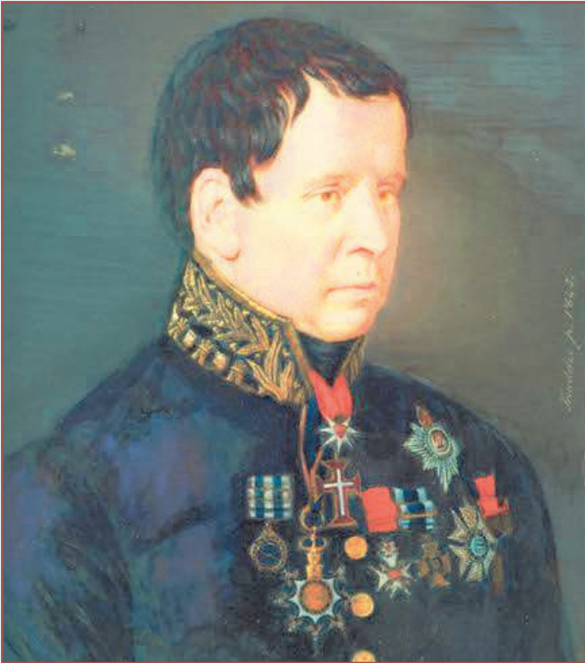
Retrato do Visconde de Beire (1845), da autoria de Tadeu de Almeida Furtado