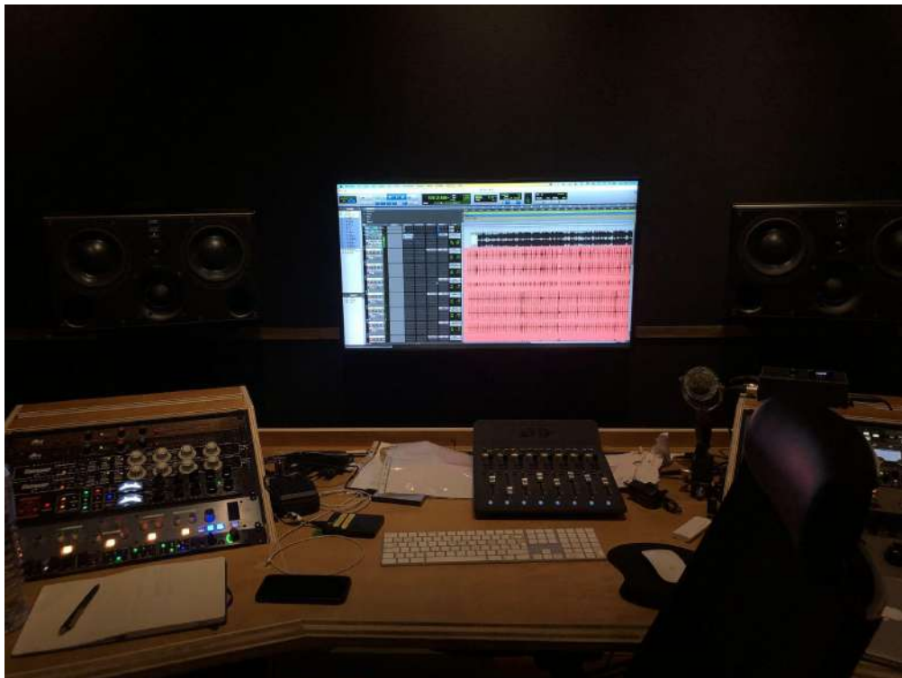
Fig.23 - Gravação da Banda em Live