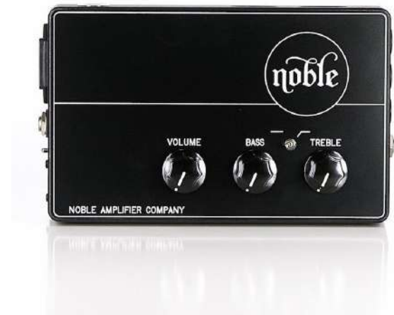
Fig.25 - Noble Pre Amp

A bateria foi o instrumento que necessitou de maior atenção assim como número de vias / microfones: