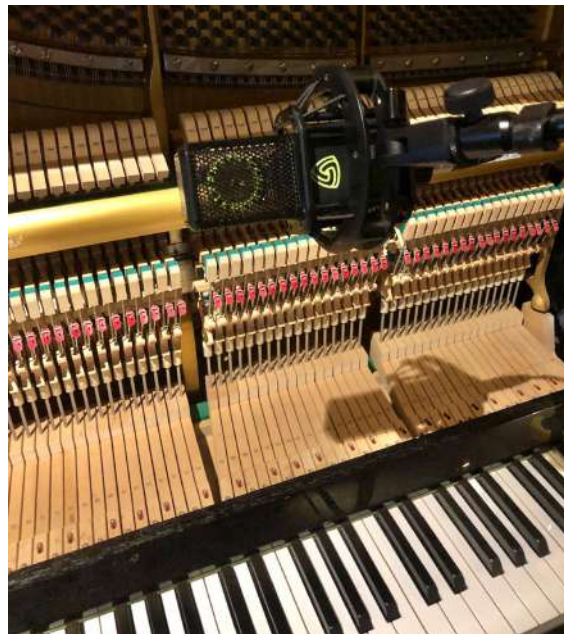
Fig.38 - Captação do Piano com Lewitt