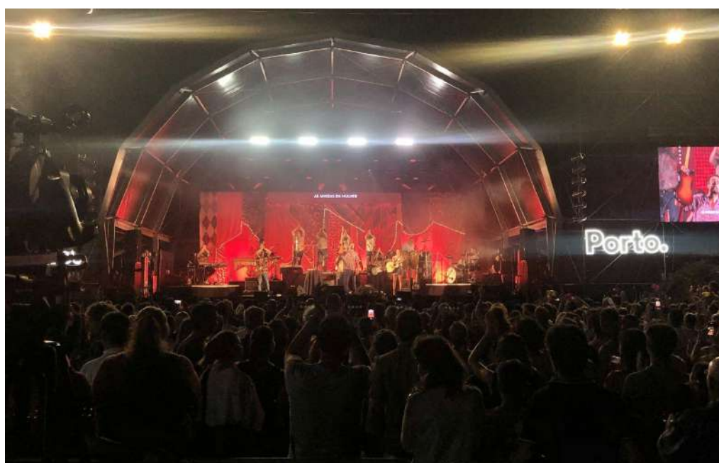
Fig.40 - Concerto São João no Porto, Super Bock Arena