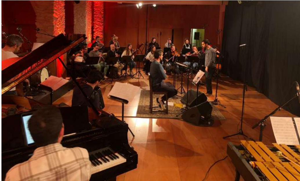
Fig.20 - Orquestra

Para a realização da gravação foi utilizada uma mesa de som digital da marca “Midas” modelo “PRO 2” ligado ao computador por uma placa com DANTE. A escuta foi feita com monitores da “IK Multimedia iLoud” e foi utilizada a DAW - “Reaper”, dado ao número elevado de vias a gravar em simultâneo (Leider, 2004). Foi utilizada a seguinte mesa dada à qualidades dos pres da stage e pelo simples facto de ser um número de canais superior a 32, o que implica haver uma mesa de som capaz de conseguir ter processamento para mais do que 32 canais.