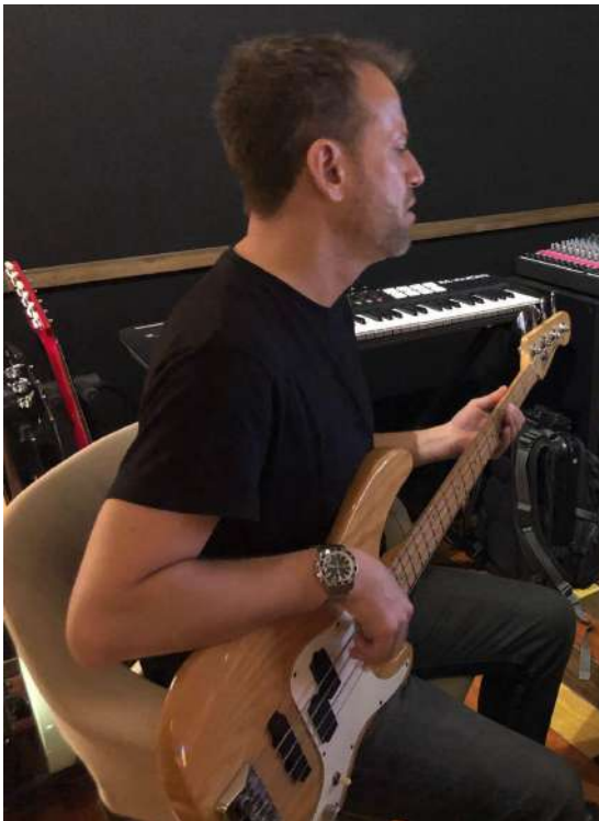
Fig.24 - Gravação Baixo

Para a gravação do baixo foi utilizado um pré-amplificador / DI Box: “Noble”.