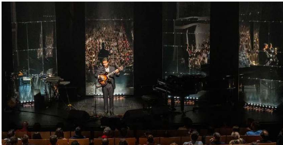
Fig.17 - Cenário “Casca de Noz”

Foi feita a gravação do concerto no Grande Auditório do Convento São Francisco, em Coimbra, de forma a divulgar nas redes sociais e plataformas digitais.