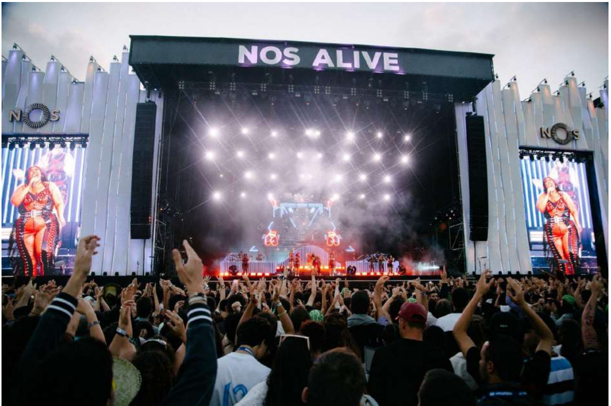
Fig.10 - Palco Nos Alive