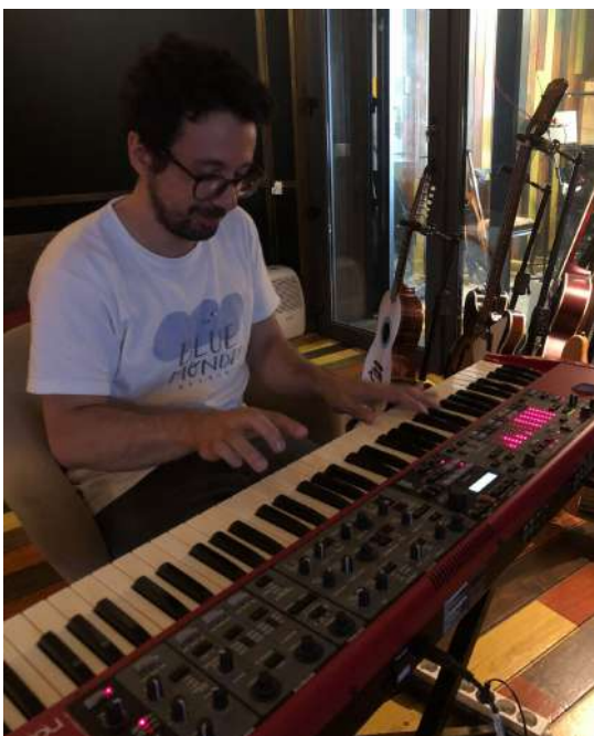
Fig.29 - Gravação de Teclados

O piano utilizado foi um piano acústico vertical, da marca Yamaha modelo U3. Para o seu registo foram usados dois pares de microfones: Lewitt LCT 640 TS e Earthworks QTC40. O piano foi gravado num total de 4 vias / canais. Já os teclados, foi utilizado um Nord Stage 1 EX diretamente ligado a dois prês da “BAE” modelo 1073MPL Serie 500.