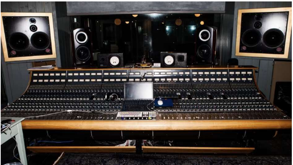
Fig.7 - Mesa de Som Analógica

Durante as décadas de 1950 e 1960, a introdução das primeiras mesas de mistura permitiu que os técnicos de som ajustassem os níveis de várias fontes sonoras em tempo real. Isso trouxe um maior controlo sobre o equilíbrio entre vozes, instrumentos e outros elementos da atuação.