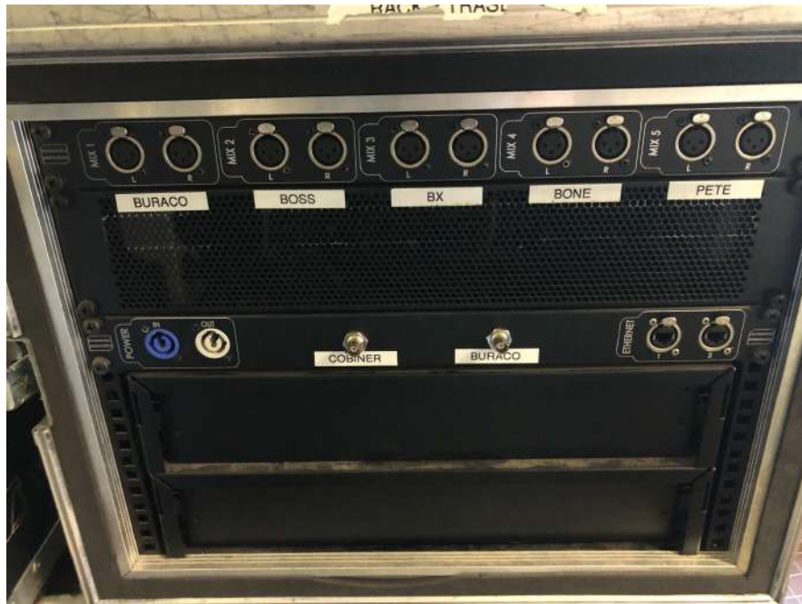
Fig.39 - Rack In Ears