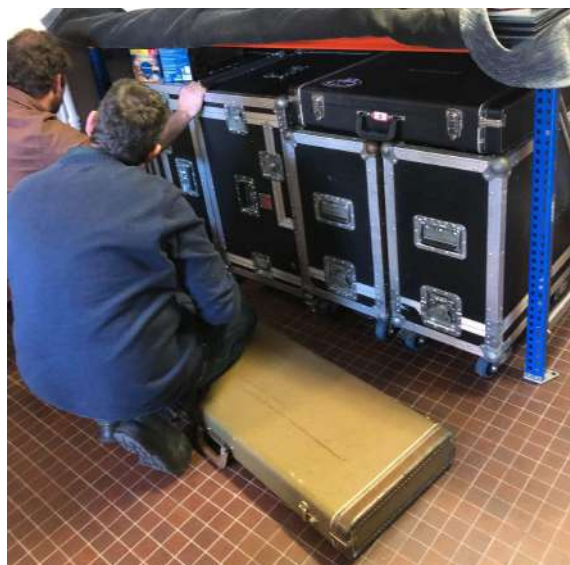
Fig.12 - Organização do Armazém

Tendo o autor já realizado um estágio curricular anterior, no ensino secundário, dentro da mesma área nos “Estúdios A.I” - André Indiana, houve uma maior facilidade no cumprimento das tarefas com alguma rapidez e assertividade, com menor percentagem de falha. Independentemente da elaboração do mesmo no passado, a constante preocupação e necessidade de explicação e compreensão de como a entidade necessitava do produto final, ajudou e clarificou o desenvolvimento e cumprimento dos deveres.