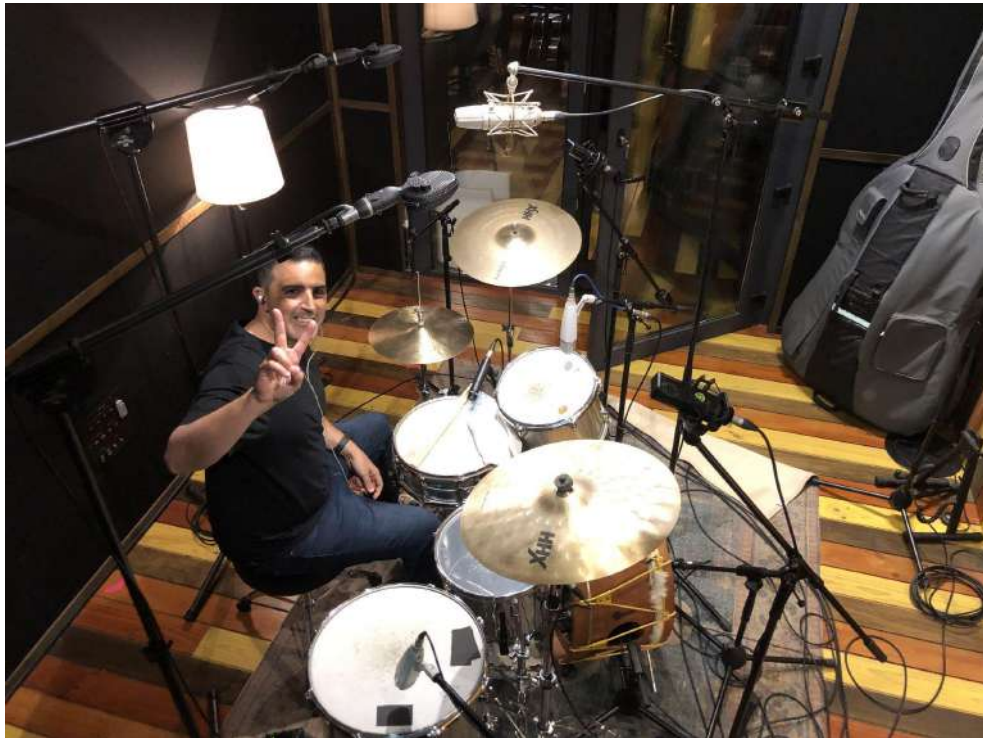
Fig.27 - Gravação da Bateria