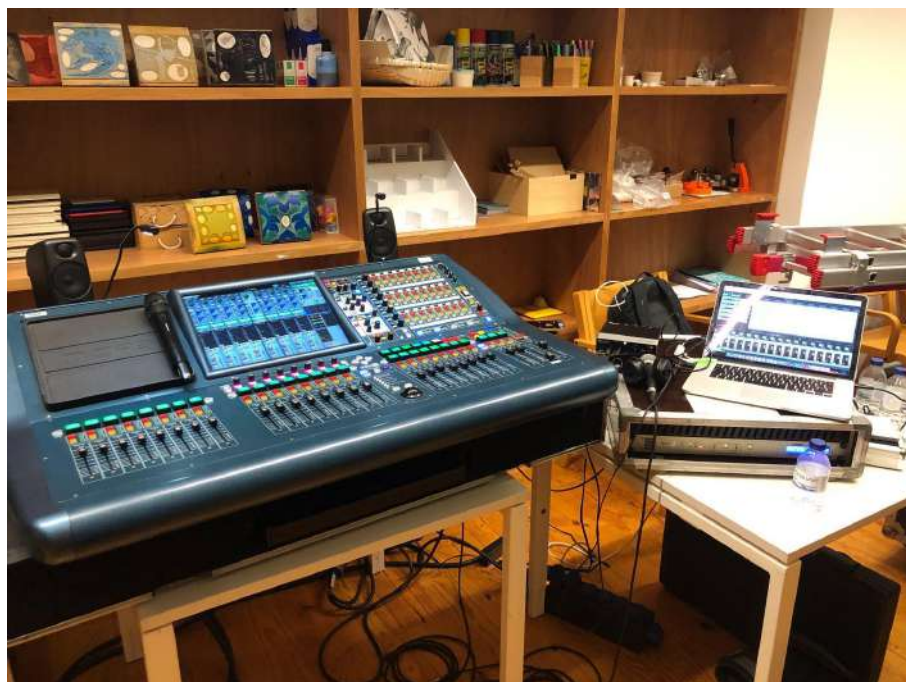
Fig.21 - Mesa de Som Digital - Midas Pro2

Para a realização da gravação foi utilizada uma mesa de som digital da marca “Midas” modelo “PRO 2” ligado ao computador por uma placa com DANTE. A escuta foi feita com monitores da “IK Multimedia iLoud” e foi utilizada a DAW - “Reaper”, dado ao número elevado de vias a gravar em simultâneo (Leider, 2004). Foi utilizada a seguinte mesa dada à qualidades dos pres da stage e pelo simples facto de ser um número de canais superior a 32, o que implica haver uma mesa de som capaz de conseguir ter processamento para mais do que 32 canais.