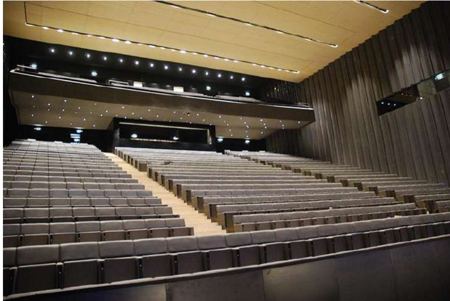
Fig.18 - Grande Auditório Convento São Francisco