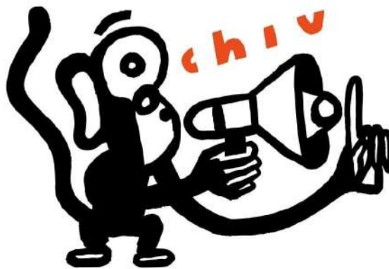
Fig.1 - Logótipo Estúdio Chiu

O “Estúdio Chiu” é um estúdio de captação e produção musical, sediado na área do grande Porto. Proveniente de uma necessidade identificada pelo conhecido cantautor Miguel Araújo, de registar os seus temas após a sua composição. “Chiu” afirma-se em 2019.