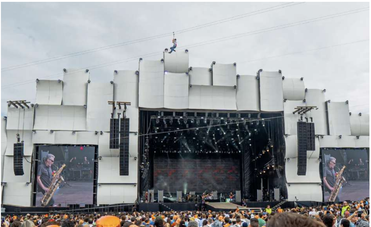
Fig.9 - Palco Rock in Rio Lisboa

Festivais de música em Portugal, como o “Boom”, “Sudoeste”, o “Rock in Rio Lisboa”, “NOS Alive” e o “Festival Músicas do Mundo”, utilizaram palcos inovadores para criar ambientes envolventes e imersivos (WIRED, 2023). Isso não apenas atraiu público local, mas também impulsionou o turismo cultural, uma vez que Portugal se tornou um destino atraente e de referência para eventos ao vivo de alta qualidade, podendo também assim artistas estrangeiros afirmarem-se. Todos estes festivais estão entre os melhores do mundo.