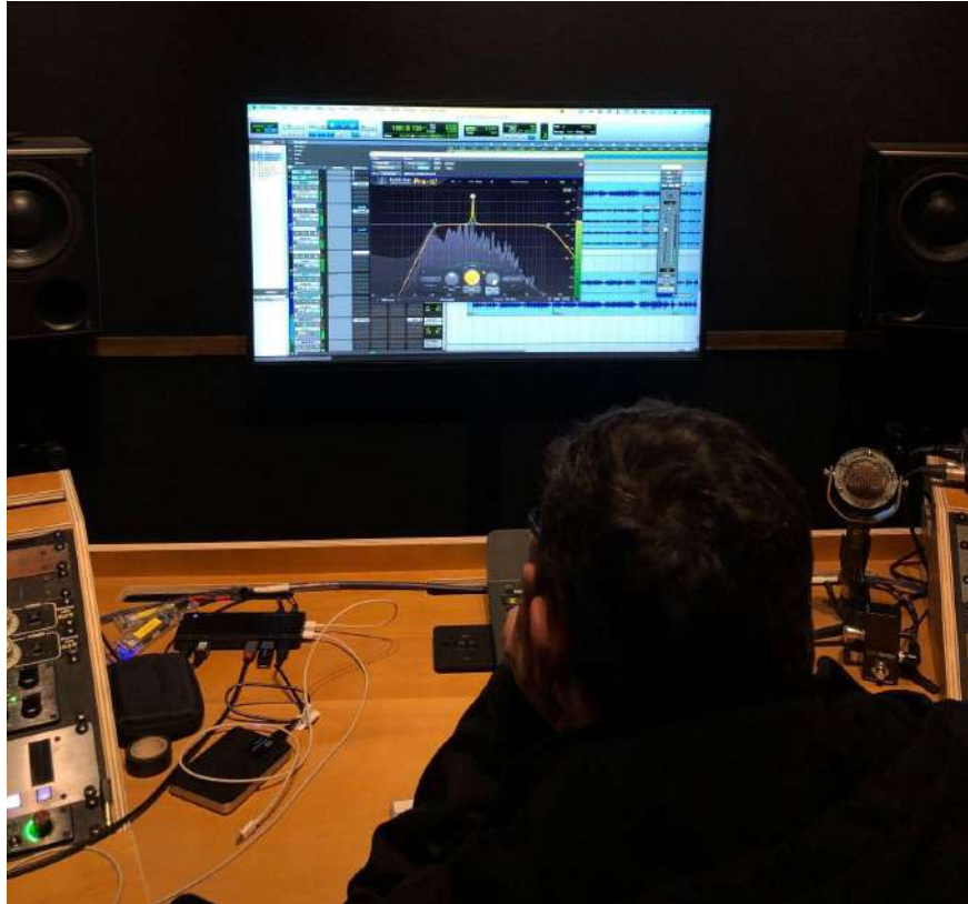
Fig.19 - Edição no Pro Tools