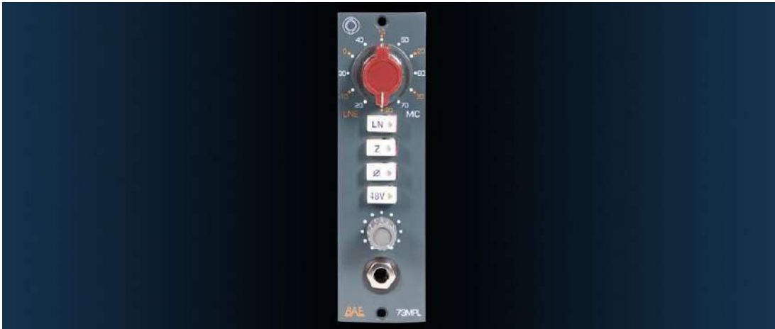
Fig.31 - Pre Amp 1073