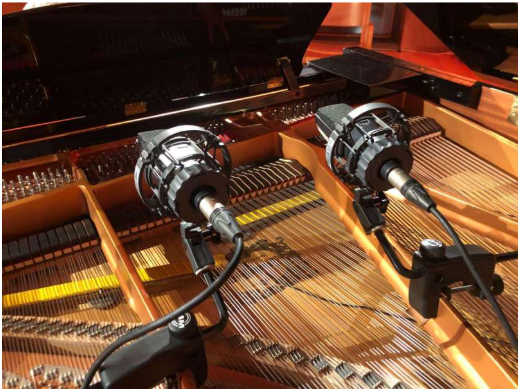
Fig.22 - Captação de Piano

Uma das técnicas adquiridas: Captação de Piano de cauda com 2 microfones de membrana larga AKG 414, com polaridade cardióide selecionada e suportes de fixação em superfícies. Foi adicionado um pickup elétrico intitulado como “Helpinstill” para reforçar um pouco os graves do mesmo, assim como para que se pudesse obter o som mais direto possível, sem estar contaminado por outros instrumentos.