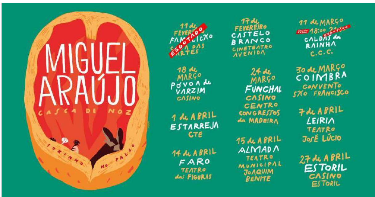
Fig.13 - Cartaz Digressão Casca de Noz

“Em 2019 dei a volta ao país numa digressão de auditórios a que chamei de "Casca de Noz". Eu, sem guião, sozinho no palco, amparado pelos meus instrumentos e pelas minhas músicas. A aventura passou pelas principais salas do país e culminou com sessão dupla no Coliseu do Porto. Na altura ainda só ia a meio do que é a minha discografia editada. Sinto que já justifica uma nova temporada. De quando em quando as minhas músicas sentem vontade de se passearem por aí da forma que vieram ao mundo. E eu tenho muitas que ainda não toquei ao vivo.” (Araújo, s.d).