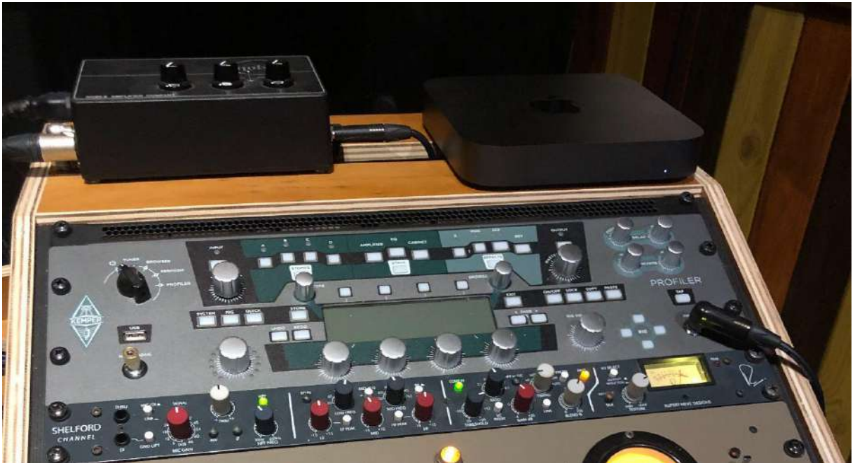
Fig.37 - Kemper e Noble

A guitarra elétrica pelo Amplificador Kemper e o baixo pelo Pré-Amplificador Noble.