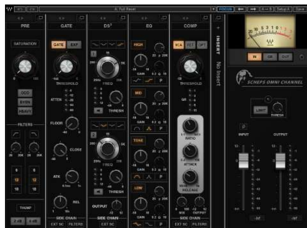
Fig.35 - Scheps Omni Channel Plugin