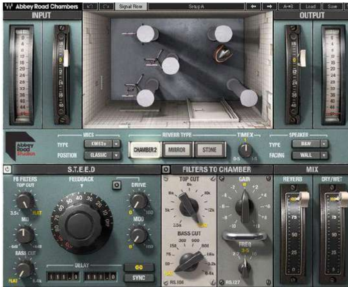
Fig.32 - Abbey Road Chambers Plugin