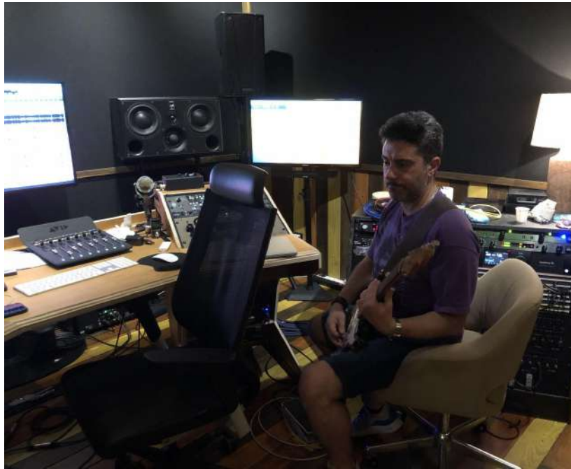
Fig.28 - Gravação de Guitarra Elétrica