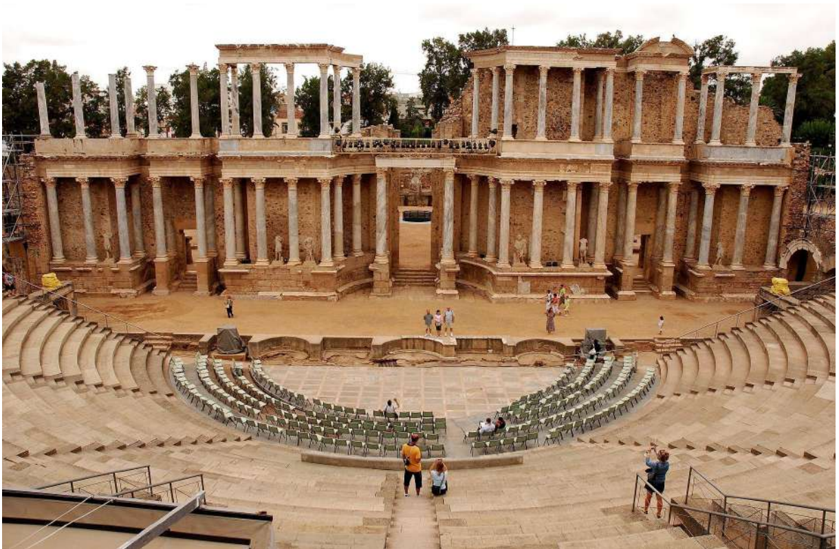
Fig.6 - Teatro Romano de Mérida (Badajoz, España)

As primeiras formas de misturar ao vivo não dispunham da tecnologia eletrônica que se tem na atualidade. Em locais como teatros gregos e os coliseus romanos, eram usadas técnicas arquitetônicas para amplificar as vozes dos atores e músicos. Além disso, os músicos e cantores eram posicionados de forma estratégica para melhorar a projeção do som para o público (Gibson, 2011).