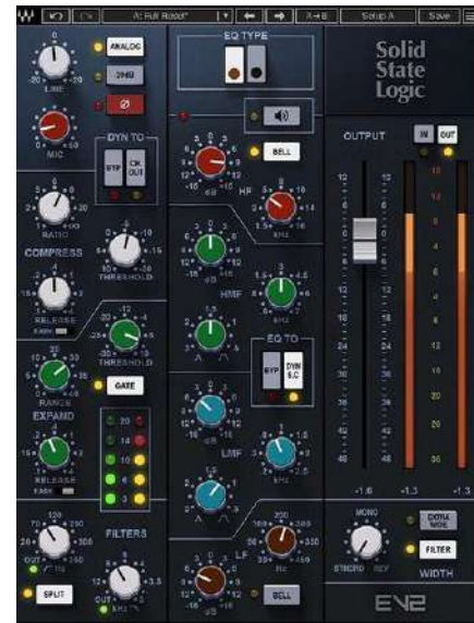
Fig.33 - SSL Channel Strip Plugin