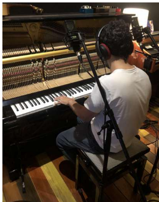
Fig.30 - Gravação do Piano