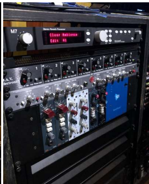
Fig.3 - Prés