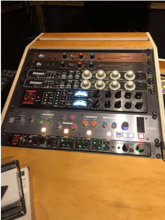
Fig.4 - Rack da StudioDesk