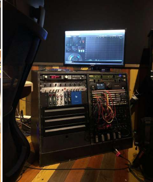
Fig.5 - Rack de Pres, Reverb e Patch