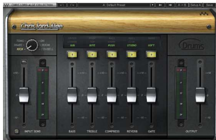
Fig.34 - CLA Drums Plugin