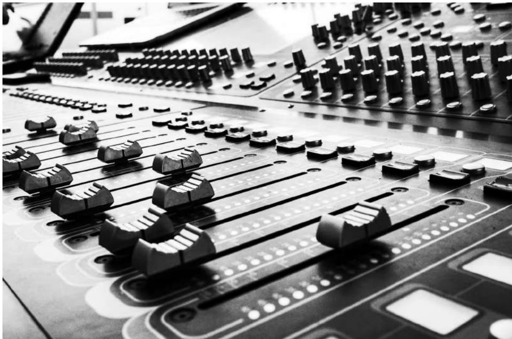
Fig.8 - Mesa de Som Digital

As mesas de mistura digitais oferecem uma flexibilidade incrível, permitindo a configuração de predefinições, automação precisa e processamento de sinal avançado. A mistura digital também facilitou a criação de mistura consistentes em diferentes locais, tornando as atuações ao vivo mais previsíveis em termos de qualidade sonora (Owsinski, 2013).