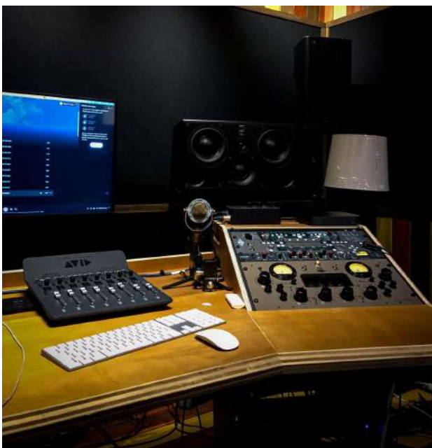
Fig.2 - Régie

O leque de amizades do cantor é o seu maior trunfo, o bom trabalho é divulgado no ramo pelo bom trabalho desenvolvido, pelo material e instalações.