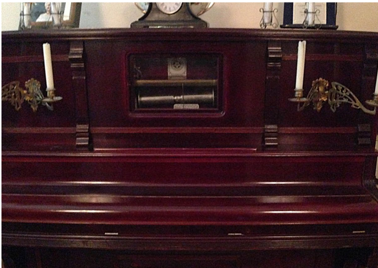
Fig. 1 – Pianola do início do séc. XX (coleção particular, Escola de Música Guilhermina Suggia, Porto). O mecanismo onde os rolos se depositam é claramente visível através da moldura ao centro.

mais abastados, as populares pianolas (fig. 1), pianos com um mecanismo de pinos e rolos de cartão que punham o instrumento a tocar, sozinho, obras originais para piano, transcrições de música orquestral e de câmara. Embora o interesse sério da musicologia no estudo das problemáticas que estes registos levantam seja recente 6 , é inegável o papel que tiveram na cultura musical, ao dar a conhecer obras inacessíveis aos melómanos portuenses, que assim tinham uma alternativa a rumar a S. Carlos ou ao estrangeiro.