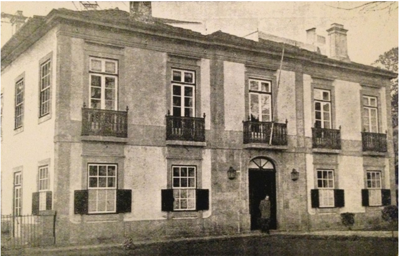
Fig. 2 – Edifício na Travessa do Carregal, onde instalou primeira sede o CMP em 1917.