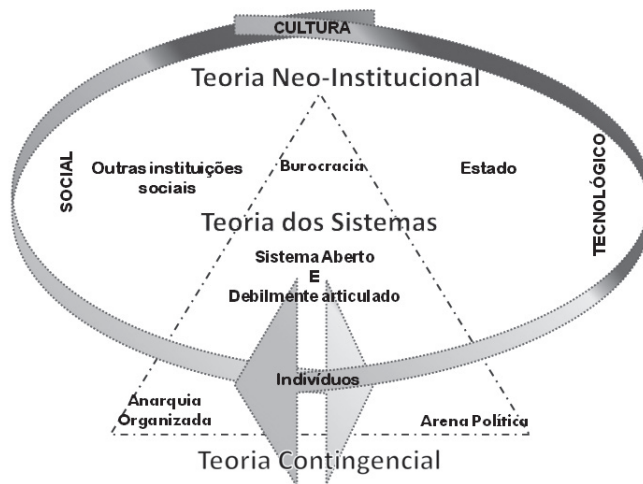
Figura 1 – Teorias Organizacionais numa perspetiva multiparadigmática

A Figura 1 procura ilustrar a relação entre essas teorias e o funcionamento da escola nos diferentes níveis.