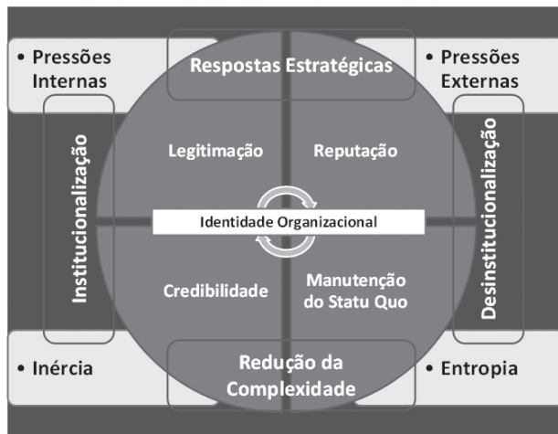
Figura 3 – A organização escolar e o seu comportamento institucional

A Figura 3 ilustra a inter-relação entre os diversos conceitos interpretativos mobilizados dentro do quadro teórico do neo-institucionalismo.