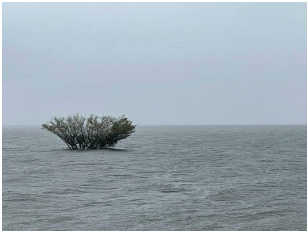
Still em digital para raccord , 05 de Março de 2022.