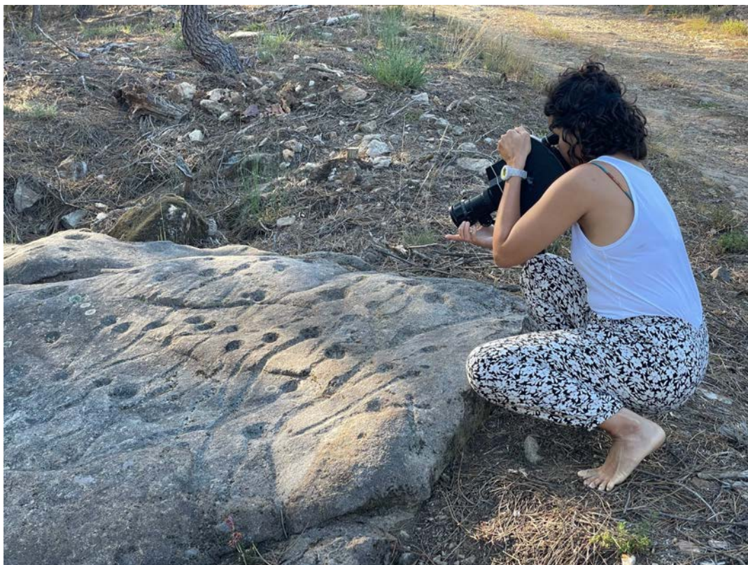
Rodagem de Super-16mm com a Krasnogorsk-3, 06 de Agosto de 2022.