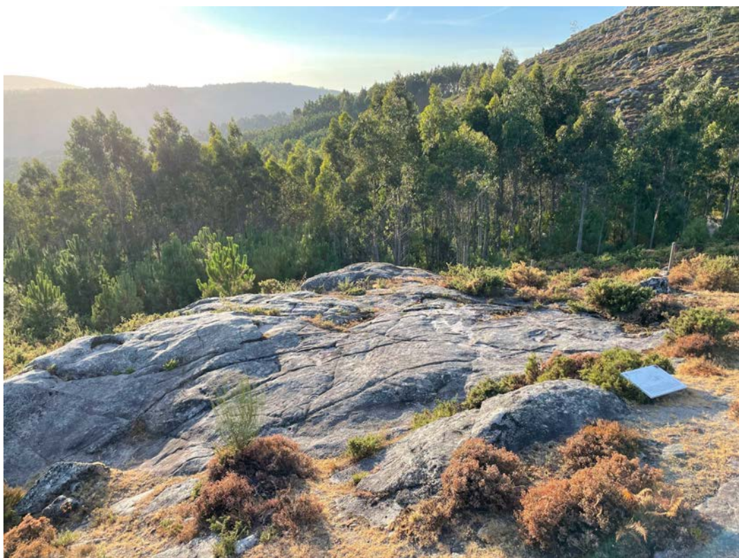
Local de rodagem, Parque Arqueológico de Monte Tetón, 04 de Agosto de 2022.