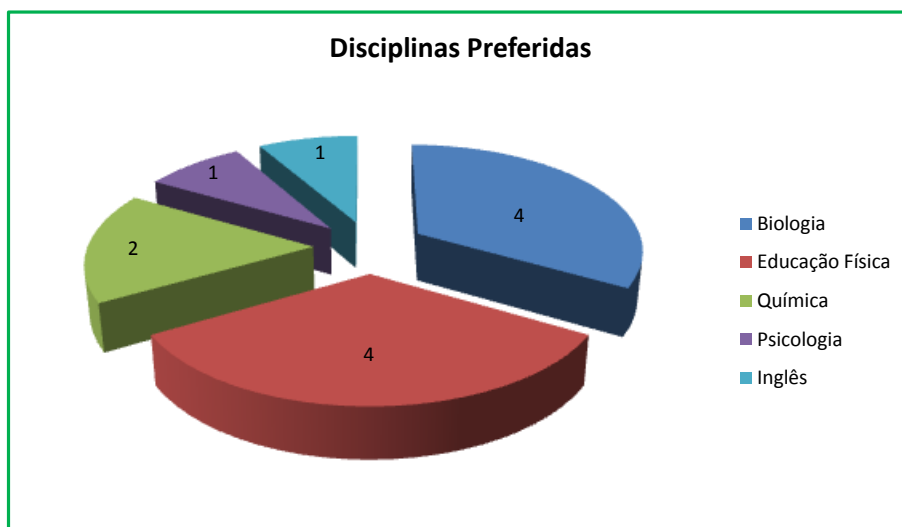
Gráfico 1 – Inquérito realizado aos alunos no início do ano letivo questionando sobre as suas disciplinas preferidas.