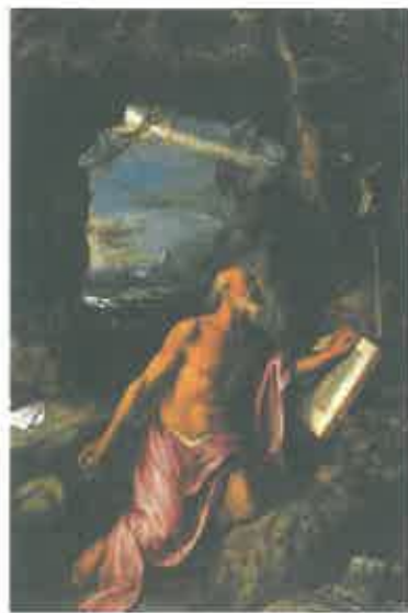
Pintura de S. Jerónimo, da autoria de Ticiano, do Mosteiro de São Lourenço do Escorial

Nada de muito especial, portanto, aconteceu em Morgido: santos que mudaram de nome, capelas de invocação, freguesias de patrono, figuras de suas iconografias, etc, eram coisas comuns no tempo antigo. A devoção popular mandou sempre mais. Até os santos tinham de provar que serviam para alguma coisa! Caso contrário mudava-se de santo ou trocava-se-lhe o nome. Assim aconteceu em Morgido: se uns não acudiam às necessidades, acorria-se a outros, mais protectores.