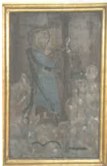
Pintura de S. Pedro, lado esquerdo do retábulo

Nessa altura, os seus altares, com licença do Ministro da Guerra, foram cedidos à “Paróquia de Gondar ... os quais esta Corporação pretende para a nova Igreja paroquial desta freguesia que está a ser construída” 36 . Não me custa admitir que Gondar, não necessitando de tudo quanto recebeu, possa depois ter cedido à ermida de Morgido o altar e o forro do tecto da citada capelinha franciscana. Não esqueçamos que, aquando da bênção da de Morgido, como atrás disse, ela tinha simplesmente o retábulo antigo que o pároco ao tempo qualificara de menos suficiente .