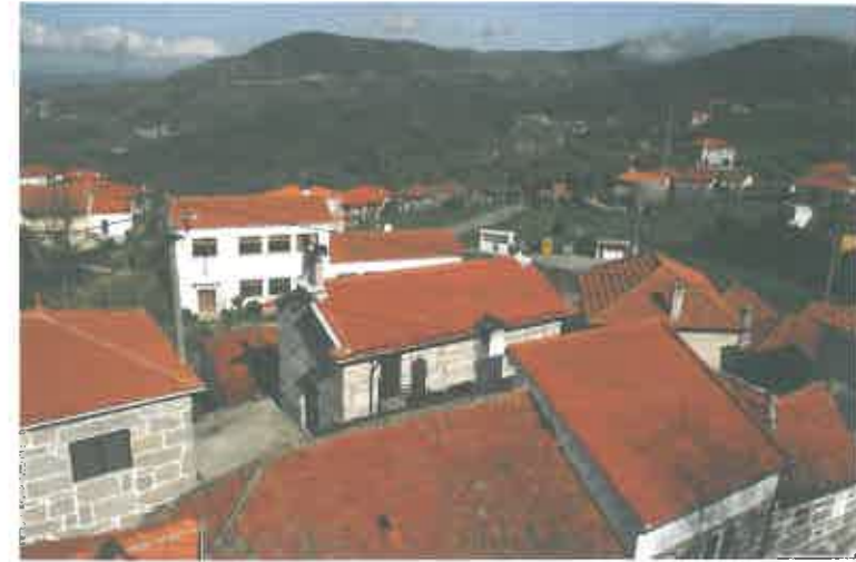
A capela da Senhora dos Remédios, no coração lugar de Morgido