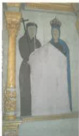
Estado actual das pinturas de S. Francisco e Sta Clara

foi posteriormente colocada uma edícula a guardar uma imagem de Santo António que obrigou à sua destruição parcial.