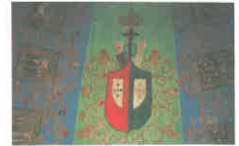
As armas franciscanas do forro

Se é estranho o franciscanismo da capela de Morgido, é legítimo admitir uma hipótese: forro e retábulo vieram de fora, comprados ou cedidos? Mas, em caso afirmativo, donde?