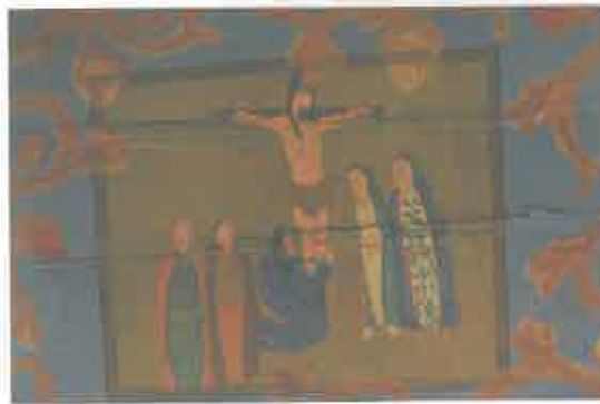
O Calvário, cena da Via Sacra

O mesmo se diga dos 14 quadros ou estações da Via Sacra 39 que são, inegavelmente, a parte mais chamativa de todo o conjunto.