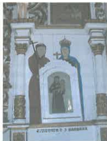
Estado anterior das pinturas dos dois santos franciscanos

foi posteriormente colocada uma edícula a guardar uma imagem de Santo António que obrigou à sua destruição parcial.