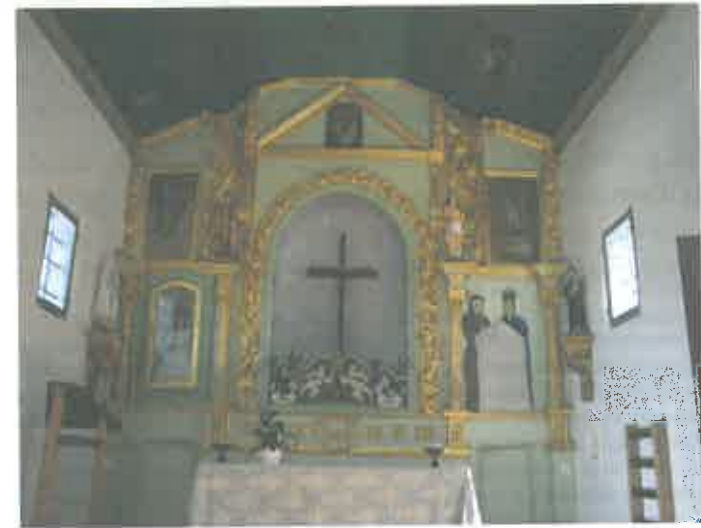
O altar-mor depois do restauro de 2002

Mal se entra, percebe-se logo, no lado direito do altar, algo de estranho: houve ali uma pintura que representava dois grandes vultos da devoção