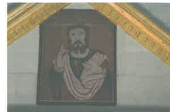
Pintura de S. Miguel, lado direito do altar-mor/Coração de Jesus, pintura do cimo do altar-mor

O seu traço é claramente mais popular, o pincel bastante grosseiro e sem grande variedade cromática, diferente, em minha pobre opinião, do das de S. Pedro e S. Miguel, de desenho mais fino e quase elegante.