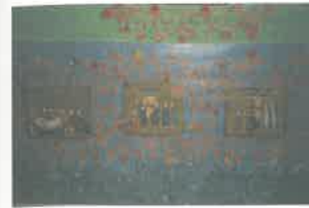
Vista parcial da Via Sacra do forro do tecto