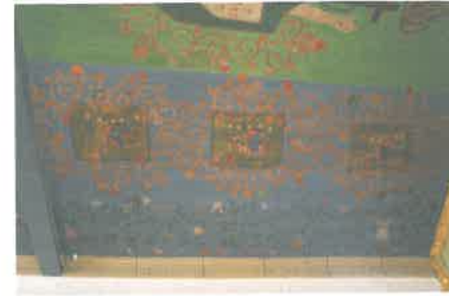
Vista parcial da via Sacra

entanto encantador. Os quadros, 7 de cada lado, são de dimensões desiguais, e estão diferentemente espaçados talvez por incapacidade de domínio da área disponível, e rodeados todos eles por um entrançado florido a sugerir intemporalidade.