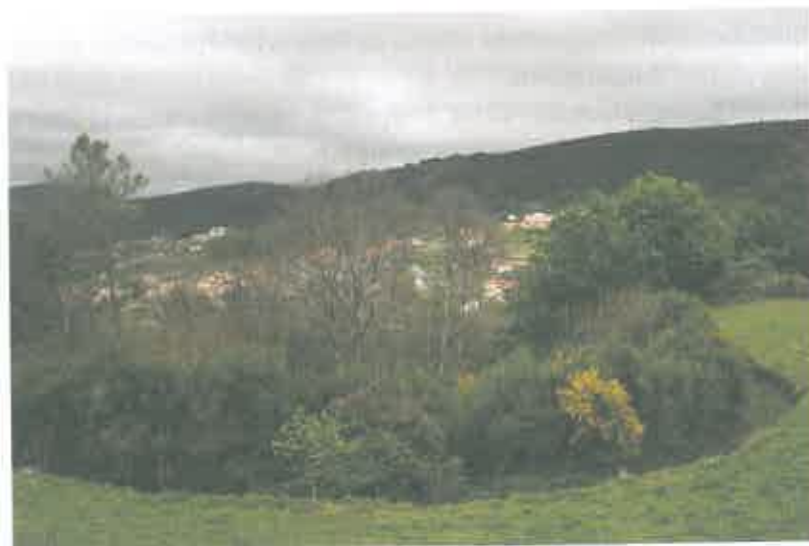
Vista de Morgido, tirada do lugar onde existiu a primeira edificação da capela

Mais tarde, em 1650, a ermida foi trasladada para lugar mais próximo da aldeia: chama-se, ainda hoje, Poça da Fonte . Finalmente, mesmo ao lado da ermida actual a que se dava já a invocação de Nossa Senhora dos Remédios, por irradiação do santuário de Lamego, existiu a Fonte da Senhora , deslocada há poucos anos um pouco para baixo mas ali muito perto ainda.