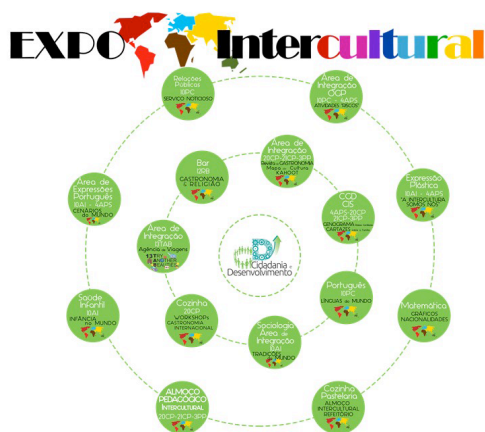
Figura 2 – Projeto “Expo Intercultural” um exemplo do resultado desta reconstrução curricular

Provocar a reflexão sobre as causas da crise dos refugiados e as respetivas questões éticas.