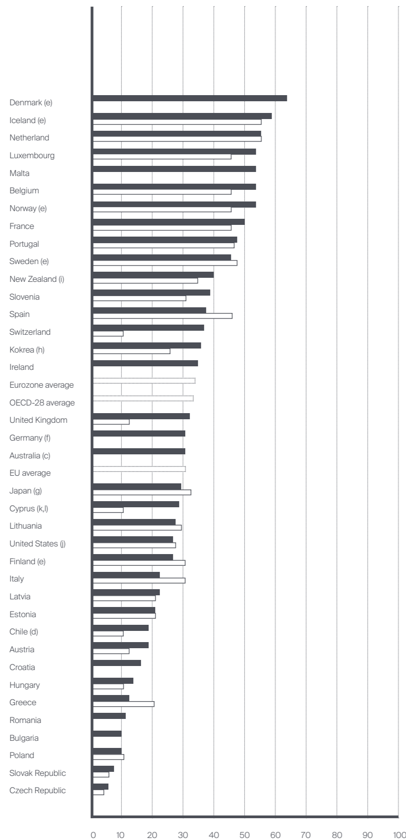
GRÁFICO N.º 1 Percentagem de crianças entre os 0 e os 2 anos que frequentam infantários e outros equipamentos sociais para este estrato etário