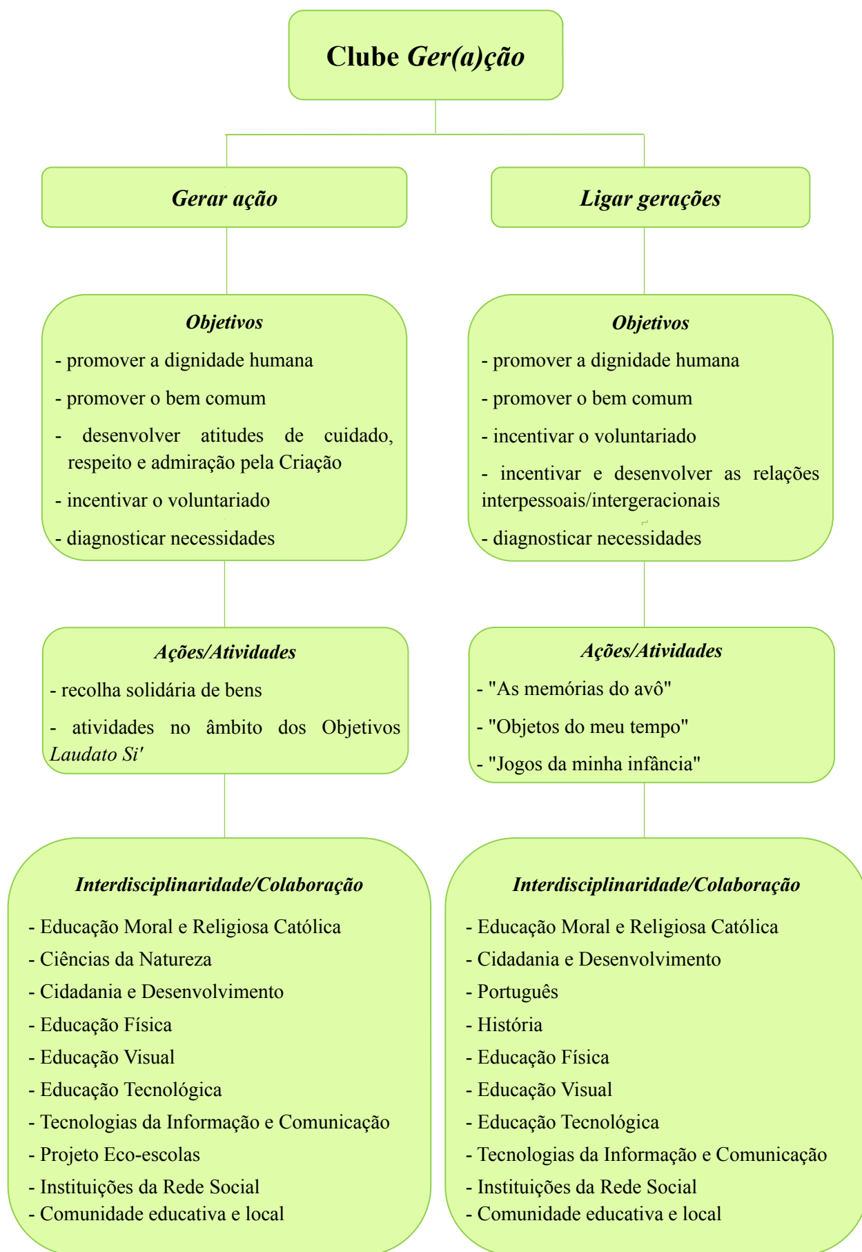
Quadro 10: Apresentação-resumo do Clube Ger(a)ção