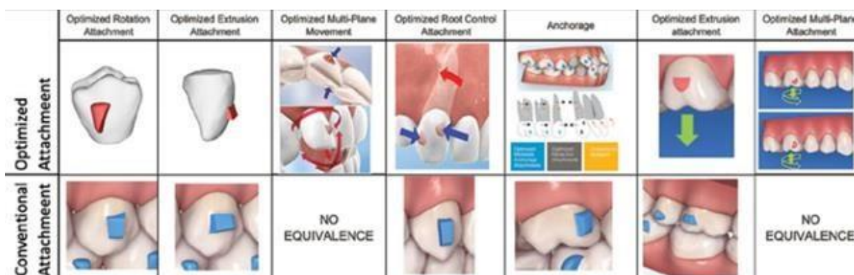
Figura 2. Attachments convencionais e otimizados, adaptado de (16).

Foram projetados para a obtenção de uma força ideal no movimento dentário, feito sob medida para: longo eixo, largura e contornos específicos, (figura 2). A sua colocação é precisa, fornecendo assim forças necessárias e eliminando as interferências. Temos com exemplo os de rotação, extrusão, movimento multiplano anterior, controle de raiz, ancoragem, extrusão posterior, multiplano posterior entre outros (16).