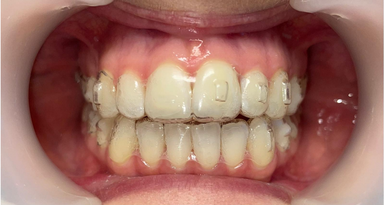
Figura 1. Alinhador transparente com attachments (17).

Os attachments produzem vetores que são específicos e complementam o movimento, mas não atuam como agentes ativos na produção da força, eles agem passivamente dentro do movimento do plástico, o qual é o responsável pelo movimento. (12,16).