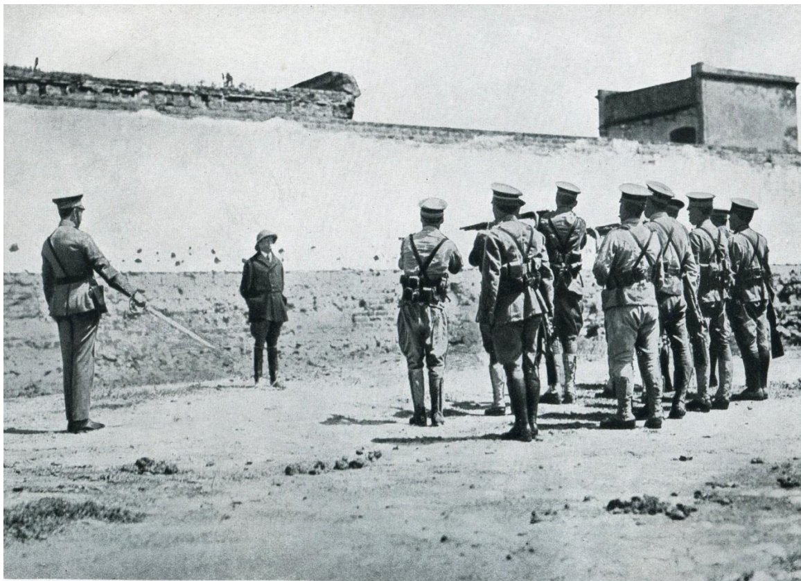
Mexiko. Vor den Mündungen der Gewehre. Erschießung des Generals Quijano nach einem gescheiterten Revolutionsversuch.