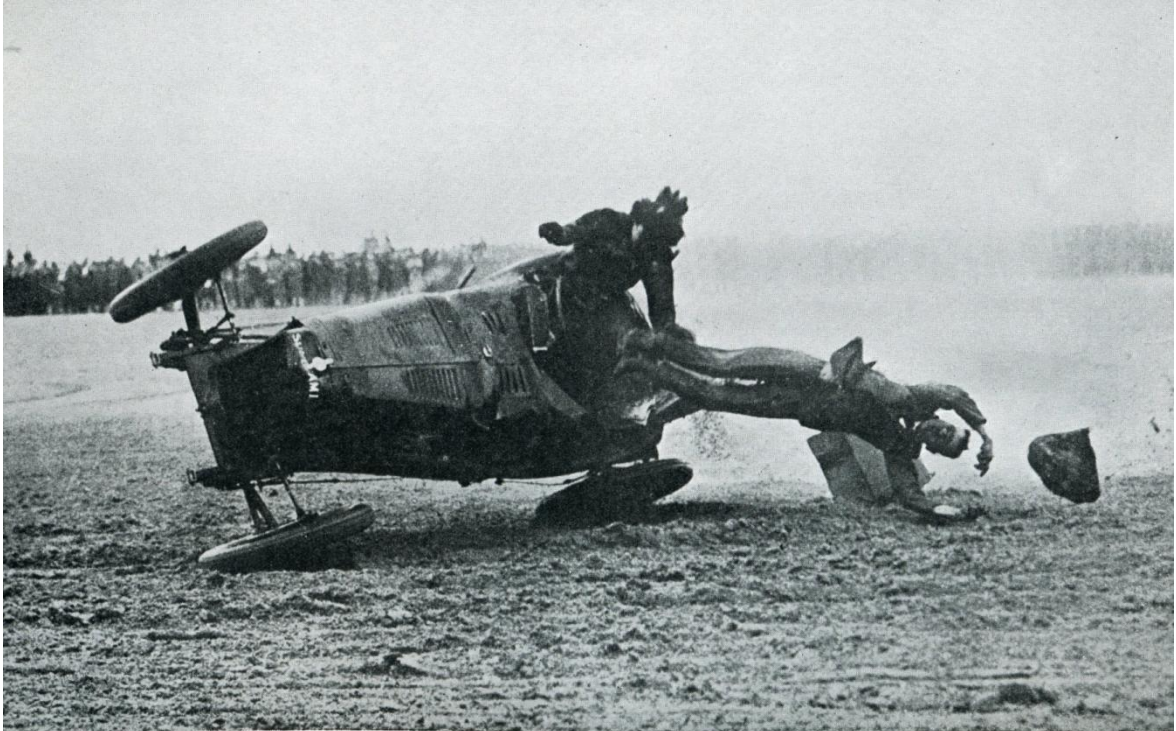
Die letzte Sekunde.