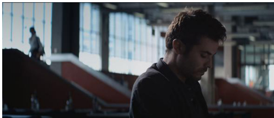
Fig. 8 - Fotograma de Voodoo , de Sandro Aguilar.

relaciona com o espaço envolvente; outro mais ficcional, aproximando-se de personagens em determinadas ações no tempo. Estes filmes desafiam noções narrativas de causa-efeito, para se concentrar em alusões aos estados de espírito das personagens. (cf. RIBAS, 2013).