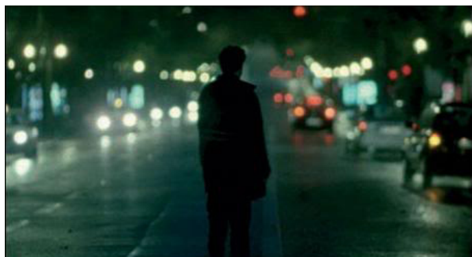
Fig. 5 - Fotogramd e Alice, de Marco Martins.

em Como desenhar um círculo perfeito (2009), aqui num olhar sobre uma família disfuncional e um amor incondicional de dois gémeos. De novo, a cidade aparece como uma imensidão claustrofóbica.