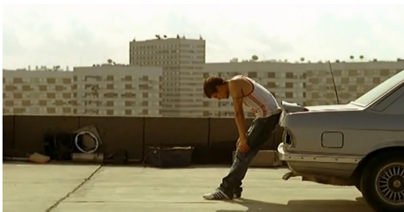
Fig. 7 - Fotograma de Arena , de João Salaviza.