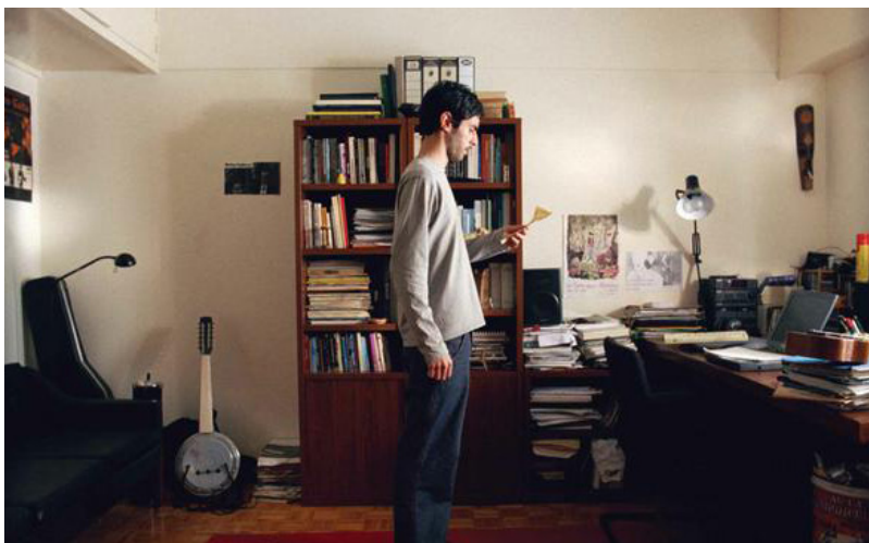
Fig. 4 - Fotograma de Rapace , de João Nicolau.