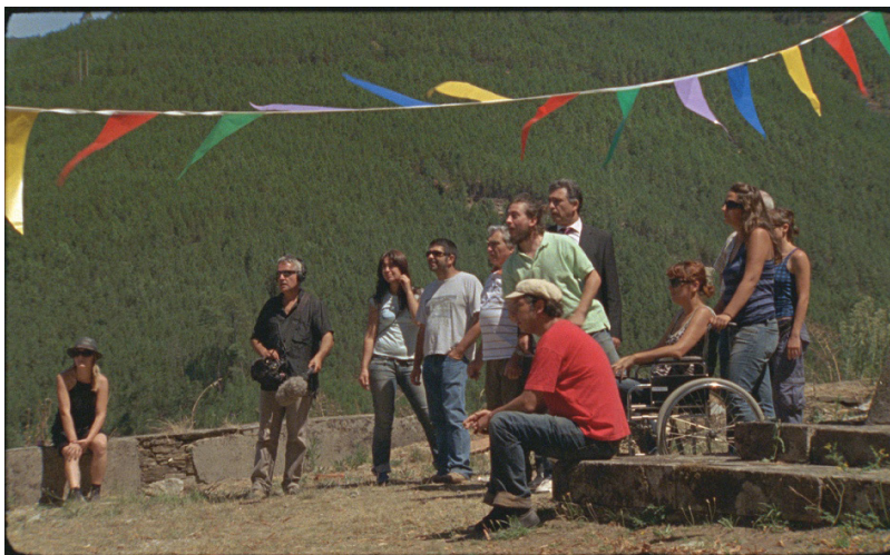
Fig. 3 - Fotograma de Aquele Querido Mês de Agosto , de Miguel Gomes.