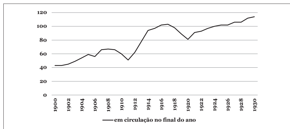
Figura n.º 1 – Periódicos em circulação, por anos

A implantação da República implicou, no imediato, uma diminuição dos títulos de periódicos católicos em circulação no espaço público (Figura n.º 1) 12 . Referimo-nos a publicações regulares, incluindo jornais, revistas e boletins, com algum conteúdo informativo e noticioso, mesmo que nem sempre de cariz geral, mas também centrado em atividades e dinâmicas sociais e religiosas e, eventualmente, destinadas a um público restrito ou com capacidade limitada de difusão e circulação. Por comparação com os últimos anos da Monarquia Constitucional, é evidente, logo no final do ano de 1910, uma quebra na imprensa em atividade, confirmada no ano seguinte. Para além da incerteza associada à transformação do regime político, a legislação de cariz anticlerical do governo provisório teve evidentes repercussões sobre a organização do catolicismo, abrangendo, inevitavelmente a imprensa.