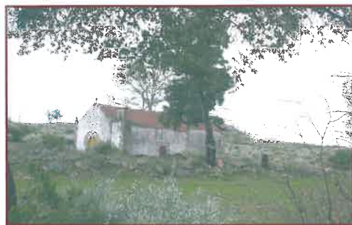
Foto 2 - Capela de Santo Amaro.

Finalmente, quem vinha de Santiago de Vale do Lobo – hoje Vale da Senhora da Póvoa, nome alterado em 1957 (a freguesia que conserva o oragado de Santiago, que era já conhecida em 1320 embora, ao tempo, sem referência ao Apóstolo) – passava em Santo Amaro, na monumental capela que ainda se pode ver, mas agora fazendo parte da Quinta de Santo Amaro: e chegava depois a Belmonte pela já referida Tapada de Santiago.