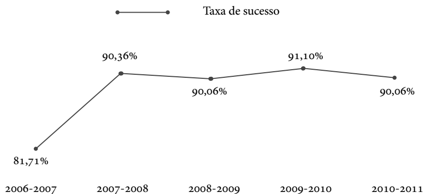
Gráfico 1. Taxa de sucesso no AE nos últimos cinco anos letivos

Sobre o abandono escolar, os últimos números (Relatório Final, 2011) revelam, também, um cenário positivo. A taxa de abandono escolar a nível