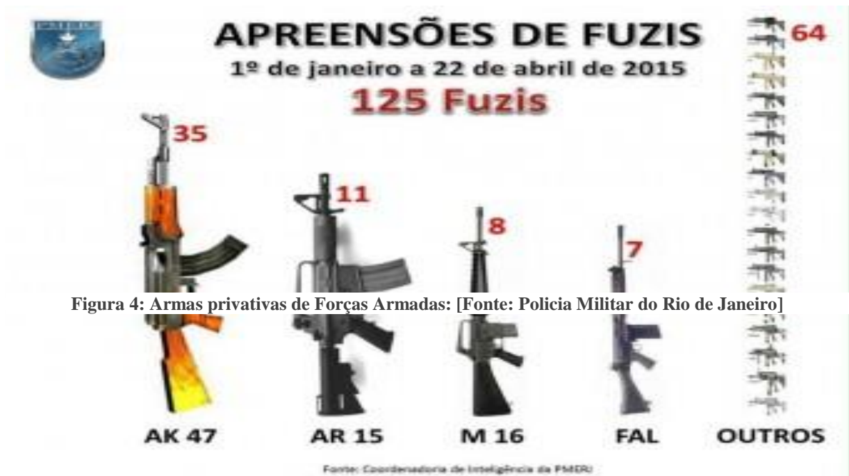
Figura 4: Armas privadas de Forças Armadas: [Fonte: Policia Militar do Rio de Janeiro]