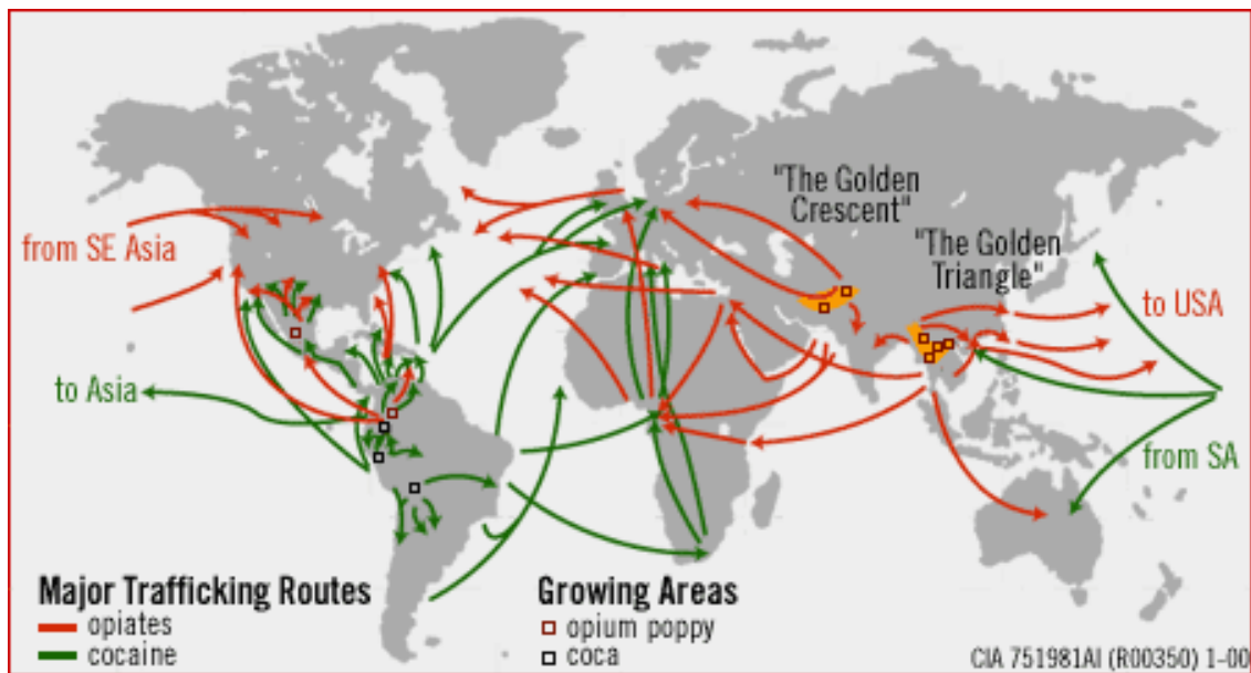
Figura 1: Rota do tráfico internacional