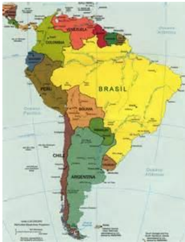
Figura 2: América do Sul: [Fonte: Guia Geográfico da América do Sul]