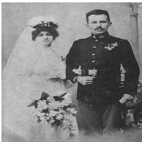
(Figura 2: Karol Wojtyła e de Emilia Kaczorowska, pais de Karol Józef Wojtyła)

Quanto à formação cultural, Karol Józef Wojtyła, após ter terminado os estudos secundários na escola Marcin Wodowita, de Wodowice, se inscreveu em 1938 na Universidade Jaguielónica de Cracóvia. Por esta altura iam-se acumulando por toda a Europa as tristes e ameaçadoras nuvens do nacional-socialismo e do comunismo, duas ideologias que marcaram indelevelmente o clima político e cultural em que se formou. Foi forçado a interromper a formação por ordem das forças de ocupação nazis em 1939 tendo fechado as portas das universidades. O Jovem para poder ganhar a vida viu-se obrigado a trabalhar na pedreira e depois numa fábrica de produtos químicos Solvay durante 4 anos (1940-1944).