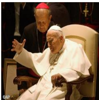
(Figura 3: Papa João Paulo II, já doente, nos últimos tempos do seu pontificado)

Relativamente à doença, o papa considera-a como «parte essencial da experiência humana e também está necessariamente no coração de toda a experiência da fé» 209 . Nenhum ser humano está imune à doença. Essa afeta toda a pessoa, direta e indiretamente, no seu corpo ou na sua mente. O próprio papa não foi poupado neste aspeto e admira-nos a forma como ele viveu a sua longa doença. Aqui está uma das principais razões pelas quais estamos convencidos da santidade do papa João Paulo II. Os doentes são os nossos irmãos, os preferidos de Deus e sofredores com e em Cristo. A missão deles é muito difícil, pois que vivem num mundo onde por vezes não são compreendidos. O Padre Lombardi quanto a este assunto, usando as palavras do papa Bento XVI, da sua Encíclica Spe Salvi lembrou que a grandeza da humanidade determina-se essencialmente na relação com o sofrimento e com quem sofre. A comunidade que não paute por acolher, nem é capaz de contribuir mediante a compaixão para assim partilhar o sofrimento e assumi-lo mesmo de forma interior, é uma sociedade cruel e desumana. 210