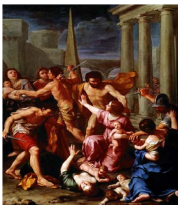
(Figura 4: O massacre dos inocentes)

O martírio é o testemunho supremo prestado à verdade da fé; um testemunho que vai até a morte com todas as consequências possíveis. O mártir é aquele que sem medo nem reserva, dá testemunho de Cristo, morto e ressuscitado, unindo-se a Ele na caridade. É aquele que dá testemunho heroicamente da verdade da fé e da doutrina cristã. É aquele que suporta a morte por um ato de fidelidade a Jesus Cristo.