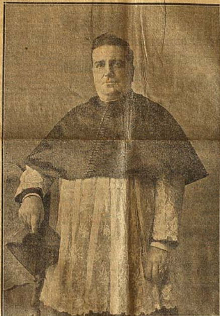
D. José Alves Corrêa da Silva (Bispo eleito de Leiria)