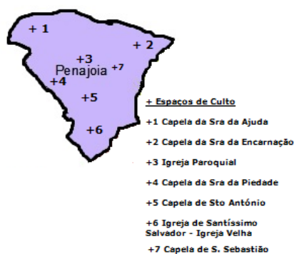
Mapa do espaço Paroquial

A paróquia não se caracteriza por ser um amontoado de exigências e imposições, mas sim por ser um espaço de oportunidades, sendo nestas, que se vive a verdadeira relação, o verdadeiro encontro com Cristo e com os irmãos.