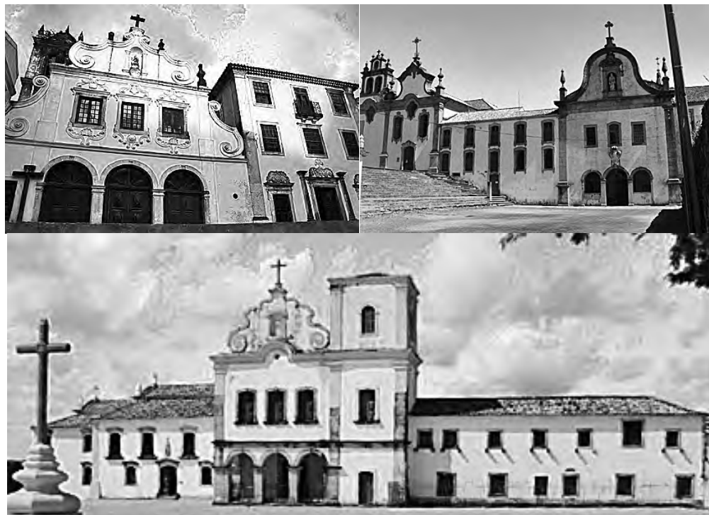
Fig. 1 - (1) - Convento/Seminário - Igreja de São Francisco e Seminário dos Missionários Apostólicos de Vinhais - ©Helena Pires 2014. (2)- Convento Franciscano de Nossa Senhora das Neves – Olinda. Fonte http://www.turismopelobrasil.net/ . (3) Igreja e Convento de São Francisco - Sergipe. Fonte: https://aventure-se.com/2013 .

As igrejas têm nave única e planta rectangular. Na parte superior da galilé encontra-se o coro-alto, com soalho em madeira e balaustrada também em madeira. Com acesso através da galeria superior do claustro, o coro-alto é iluminado por três janelas e pode ter acesso à torre sineira. No caso de Vinhais este espaço dá acesso a igreja da Venerável Ordem Terceira. De salientar que a galilé só surge no século XVIII, pois até era um elemento destacado da igreja, um alpendre anexado à fachada 5 .