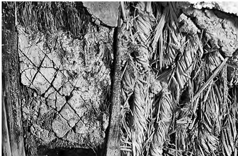
Fig. 5 - Trançado de Palha - Preenchimento das paredes interiores [Sistema Fachwerk] - Convento/Seminário - Igreja de São Francisco e Seminário dos Missionários Apostólicos de Vinhais - ©Helena Pires2011.

empregados, assim como na procura da harmonia entre os espaços interiores e exteriores e a relação destes com a natureza.