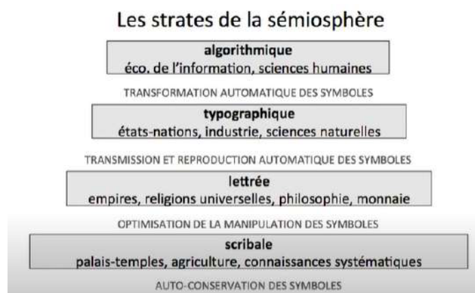
Figura 1 – Pierre Lévy (4, de julho, 2016). O Big Data e a próxima revolução científica.

Hoje vivemos num tempo de transição de uma sociedade tipográfica para uma sociedade algorítmica (Pierre Lévy, Figura 1) em que se procura a expansão da inteligência humana coletiva (a internet representa a expressão da inteligência humana), que interliga informações e transforma tudo em símbolos.