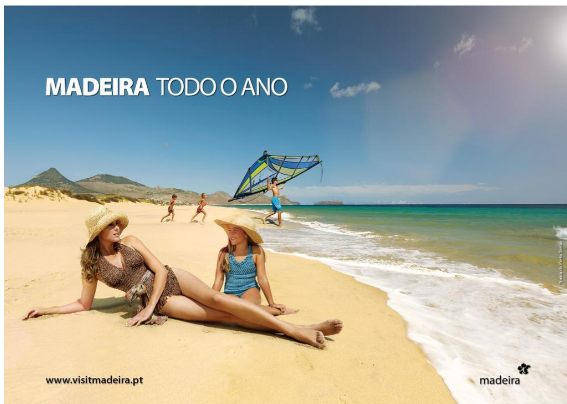
Figura 9: Imagem não temática da campanha “Madeira todo o Ano”.

mulher, e a aventura representada pelo fato de se fazer uma caminhada a pé por entre a natureza.