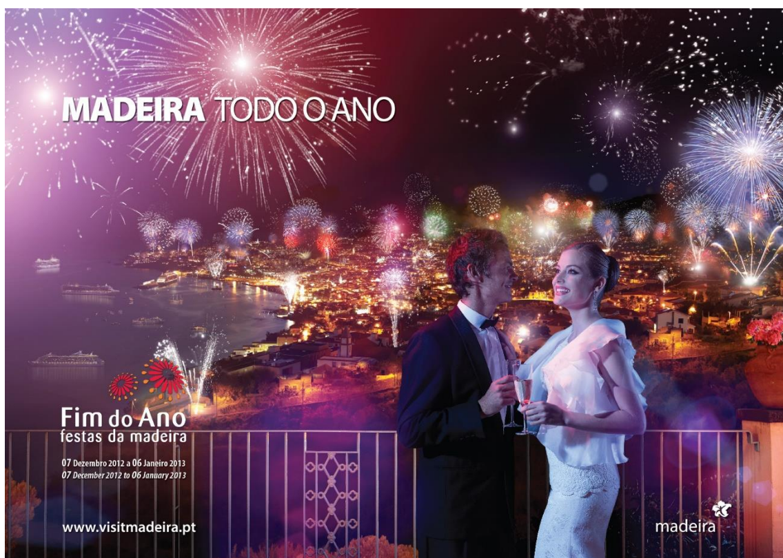
Figura 4: Imagem referente ao Fim de Ano da campanha “Madeira todo o Ano”.

Ao analisarmos a imagem da Festa do Fim de Ano temos dois elementos que se destacam. Um deles é o fogo-de-artifício que exemplifica fielmente o espetáculo da passagem de ano na Madeira. Outro elemento é o casal, elegantemente vestidos e a brindar com champanhe, que nos remete para a ideia de romance e glamour , e representa uma vez mais a beleza feminina. É destacado ainda o mar, que podemos ver na imagem uma vez que no mar do Funchal se reúnem dezenas de barcos para assistir a este espetáculo. Se olharmos detalhadamente para o mar, podemos ver o porto do Funchal, a “pontinha”, e alguns barcos que tanto transmitem a ideia de que esta festa é virada para o turismo, como que a Madeira está ligada à emigração. Esta imagem mostra-nos ainda a beleza paisagística do anfiteatro do Funchal que é aqui representado com grande destaque, numa das noites em que este está mais belo. Encontramos ainda um grande aglomerado de luzes na baixa do Funchal, e um pouco por todo o anfiteatro que representam, com pouco destaque, o Natal e as festas da Madeira. Com pouco destaque encontramos novamente algumas flores