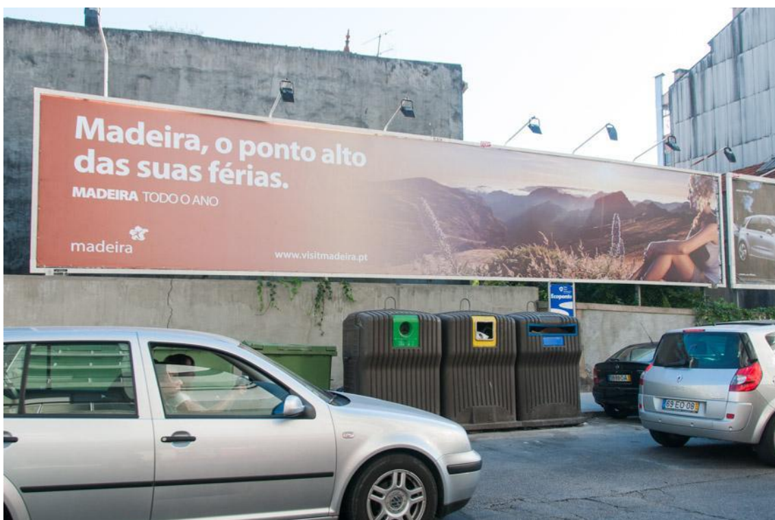
Figura 10: Outdoor com anúncio da campanha “Madeira todo o Ano”.

Para analisarmos melhor esta campanha, escolhemos a semana de 7 a 13 de Outubro de 2013, e analisar as peças da campanha “Madeira todo o ano” inseridas no mercado nacional durante essa semana. Uma vez que a partir do mês de Outubro o próximo cartaz cultural que acontece na Madeira é o fim de ano, essa semana incidiu com a grande promoção da Festa do Fim do Ano. Ainda assim, foram publicados outros cartazes turísticos nessa semana, pelo que nos pareceu um bom período para analisarmos as peças desta campanha.