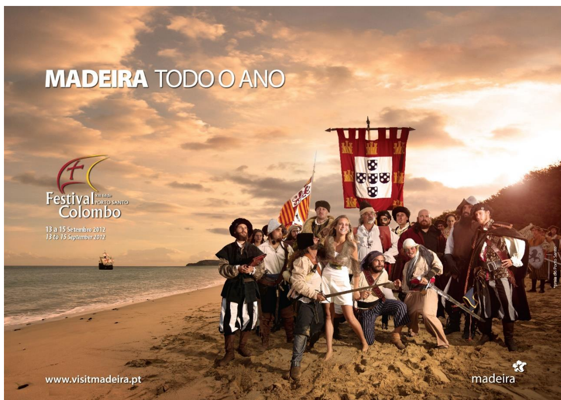
Figura 5: Imagem referente ao Festival Colombo da campanha “Madeira todo o Ano”.

estrategicamente colocadas na imagem, por exemplo na coluna da varanda onde o casal está, que mais uma vez mostram que na Madeira podemos ver flores todo o ano. A imagem no seu todo remete-nos para as ideias de tradição, hospitalidade e glamour .