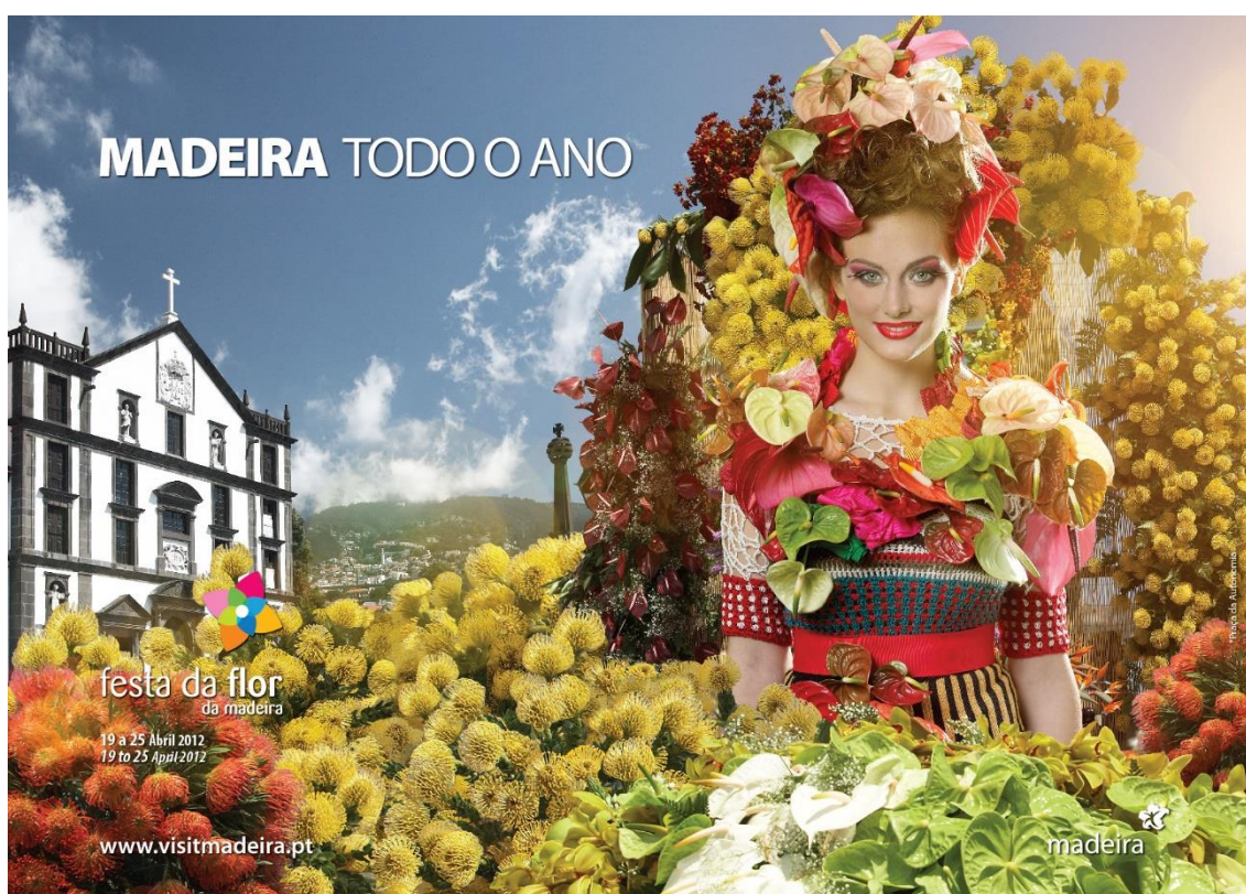
Figura 2: Imagem referente à Festa da Flor da campanha “Madeira todo o Ano”.

centro do Funchal nesta época do ano. Analisando esta imagem, tendo em conta os elementos da Madeirensidade, os que têm maior destaque são as festas e a beleza feminina que são transmitidos pelos foliões que vemos na imagem. Existem ainda outros elementos da Madeirensidade que são representados com menos destaque. O mesmo grupo de foliões, principalmente na imagem da mulher, transmitem a ideia de hospitalidade através da sua expressão facial e modo de estar, a ideia de aventura por toda a energia que envolve a festa do Carnaval, e a de tradição, pois o Carnaval da Madeira é festejado há muitos anos. Podemos notar que a imagem transmite a ideia de bom clima que se faz sentir na época do carnaval, tanto pela qualidade da imagem como pela roupa que a mulher ostenta. A Sé Catedral mostra-nos que há aqui uma alusão à história da Madeira e ao seu património cultural, e também ao facto de o povo madeirense ser um povo religioso. Esta imagem mostra-nos ainda, de um modo muito subtil, que o povo madeirense está virado para o turismo, através do grupo de foliões com as suas expressões acolhedoras.