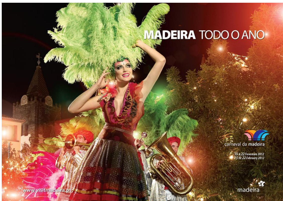
Figura 1: Imagem referente ao Carnaval da campanha “Madeira todo o Ano”.

Analisamos cada uma destas mensagens base, descrevendo quais os elementos da Madeirensidade que nelas podemos encontrar, de que modo estes se expressão e se têm muito ou pouco destaque na imagem. A imagem analisada é encontrada antes de cada texto referente à sua análise.