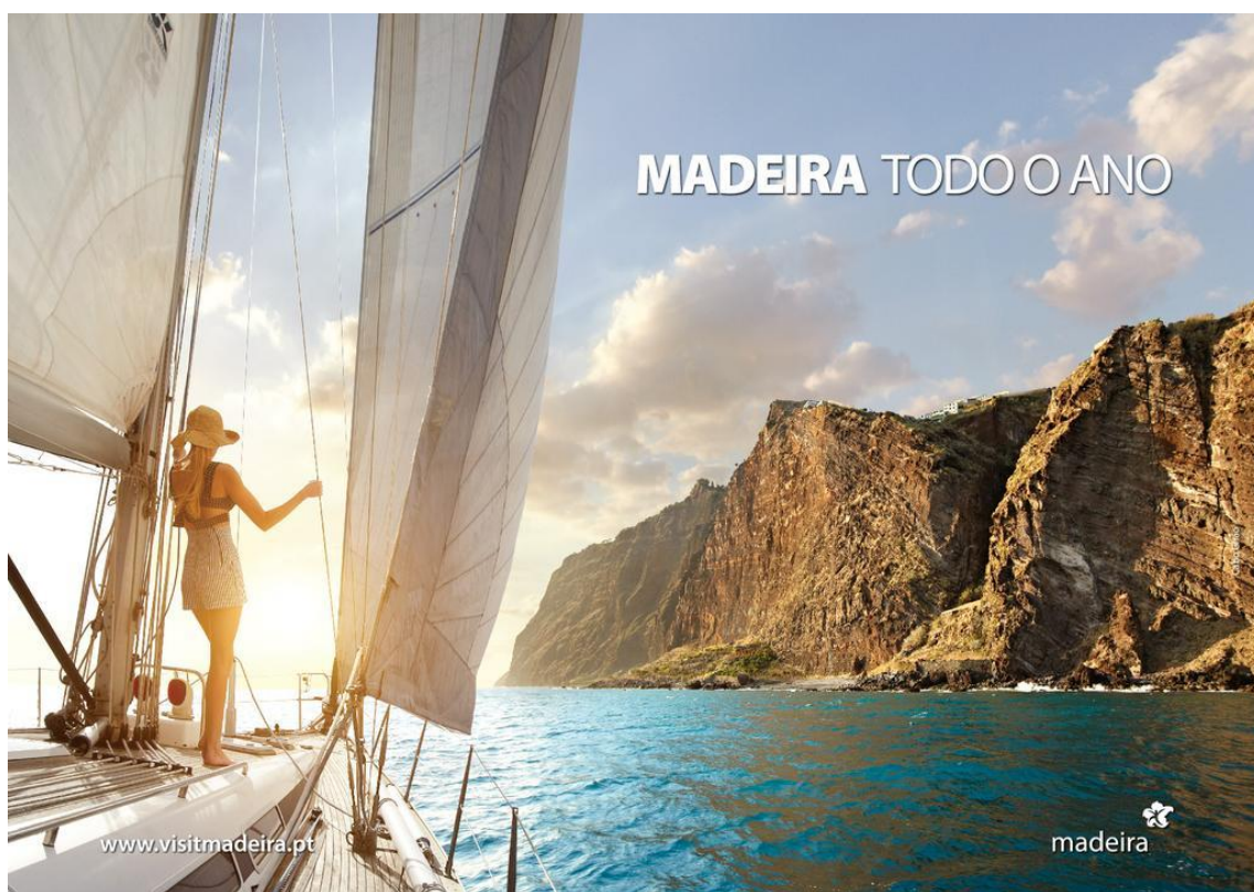
Figura 7: Imagem não temática da campanha “Madeira todo o Ano”.

Na imagem que promove o mar da Madeira, destaca-se o mar e a beleza paisagística, onde podemos ver o Cabo Girão, o promontório mais alto da Europa, que constitui um ex-líbris da Madeira. O barco que vemos na imagem representa as aventuras que podemos viver na Madeira. Com pouco destaque aparece o clima ameno, representado pelo sol e pela ideia de bom tempo que a imagem traduz.