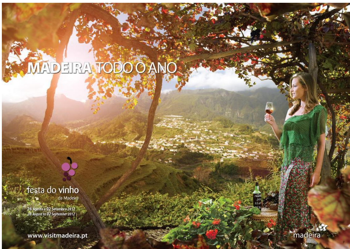
Figura 3: Imagem referente à Festa do Vinho da campanha “Madeira todo o Ano”.

A representar a Festa do Vinho temos uma imagem onde identificámos logo o Vinho Madeira, tanto através da garrafa que aparece na imagem, como do copo que a mulher segura. Nesta imagem está também representada, com grande destaque, a beleza paisagística da ilha, e nela a agricultura, pois no fundo da imagem vemos os poios cultivados com vinhas que dão origem ao famoso Vinho Madeira. Encontramos novamente destacada a mulher que representa a beleza feminina madeirense, que cujo modo acolhedor representa a hospitalidade madeirense. Ao analisarmos detalhadamente, conseguimos ver que através da garrafa de Vinho Madeira, e de todo o cenário envolvente, está representada um pouco de história da Madeira e das suas tradições. Na parte inferior da imagem encontramos, com pouco destaque, algumas flores que foram estrategicamente colocadas por as flores terem um papel importante na Madeirensidade. A imagem que parece ter sido captada num final de tarde, representa subtilmente o clima que se faz sentir na Madeira durante todo o ano.