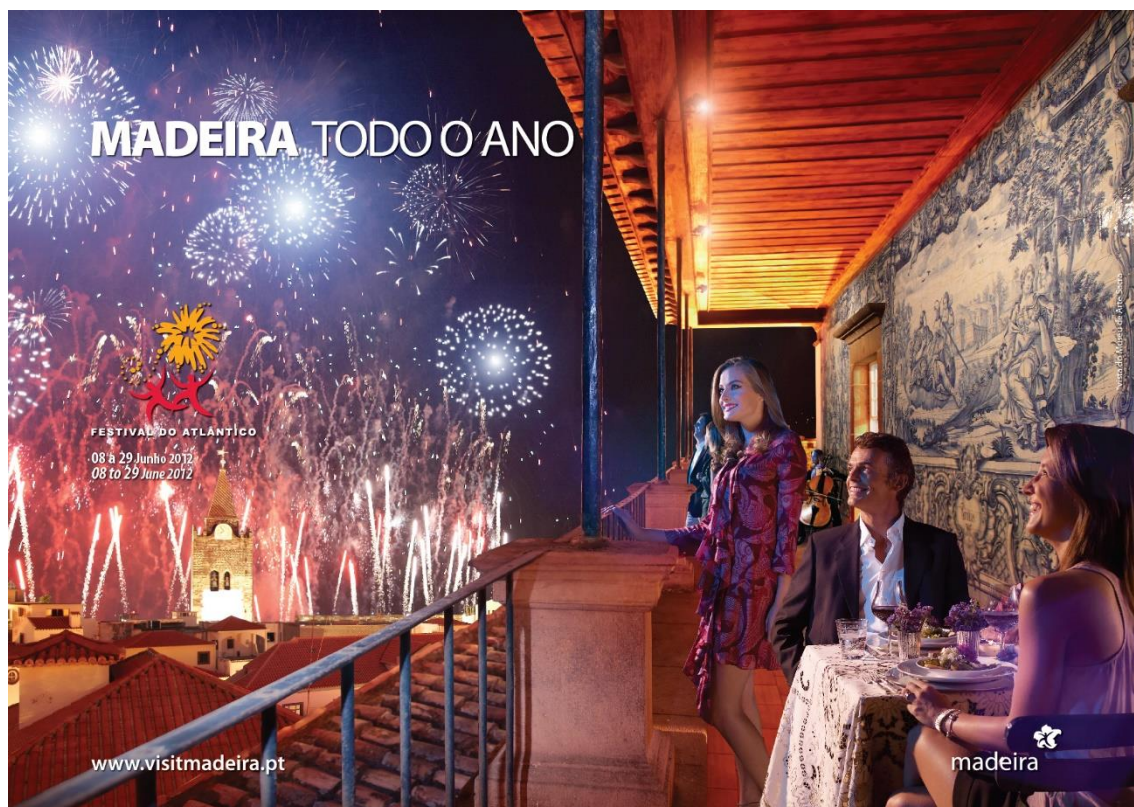
Figura 6: Imagem referente ao Festival do Atlântico da campanha “Madeira todo o Ano”.

praia. O grupo que representa os descobridores refletem, ainda que com pouco destaque, a aventura, a tradição e a beleza feminina. O clima ameno é mais uma vez representado na imagem, com o pôr-do-sol.