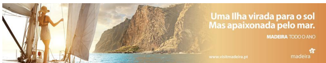
Figura 11: Outdoor com anúncio da campanha “Madeira todo o Ano”.

usa. A imagem é acompanhada pelo copy “Madeira, o ponto alto das suas férias”, que faz um trocadilho com o relevo da ilha e com os momentos de aventura que se podem disfrutar na Madeira. Neste anúncio encontramos ainda o slogan “Madeira todo o ano”, o site www.visitmadeira.pt , e o logótipo da marca Madeira.