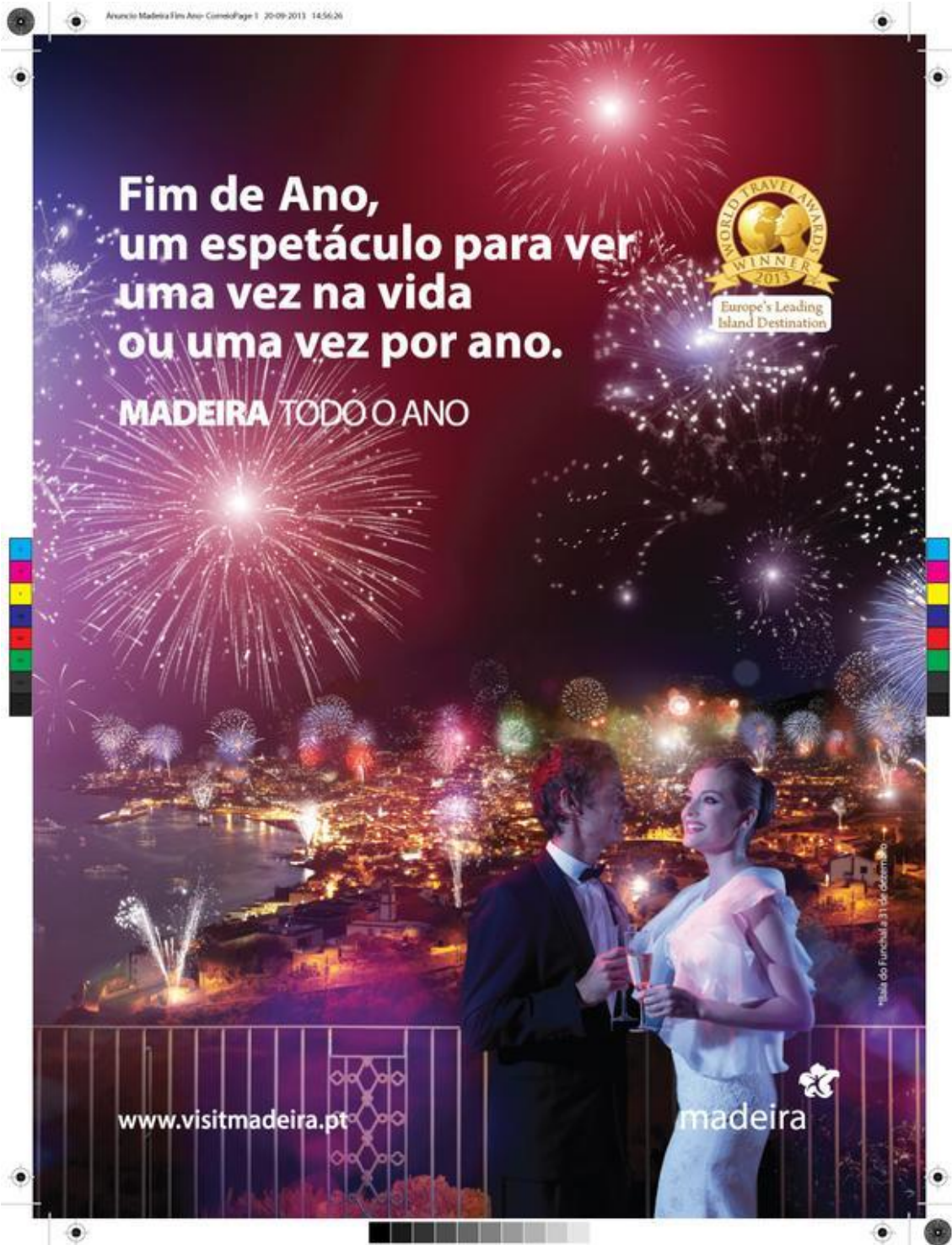
Figura 14: Inserção do anúncio da campanha “Madeira todo o Ano” na publicação do jornal Correio da Manhã, de 13 de Outubro de 2013.

Nessa mesma semana foi usado uma inserção da imagem relativa ao Fim de Ano em diferentes meios, de modo a que este fosse o cartaz mais promovido. Estas aplicações