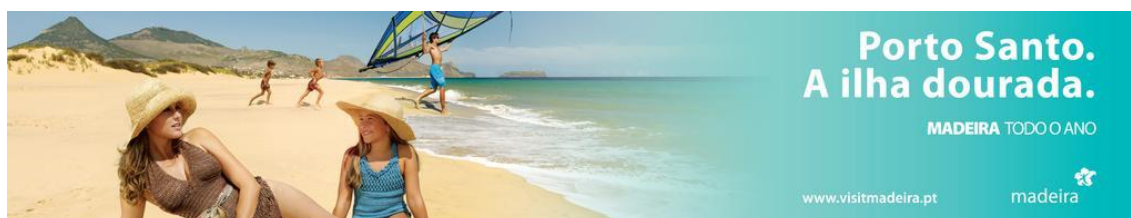
Figura 12: Outdoor com anúncio da campanha “Madeira todo o Ano”.

Já em Braga estava também uma lona de grande formato (16mx 3m), com um anúncio da imagem do Mar. Esta peça publicitária é igual à imagem base, mas acresce o copy “uma ilha virada para o sol mas apaixonada pelo mar”, que realça o sol que está presente na Madeira durante todo o ano, e o mar que a rodeia e permite fazer várias atividades. Também este anúncio é acompanhado pelo slogan “Madeira todo o ano”, o site www.visitmadeira.pt , e o logótipo da marca Madeira.