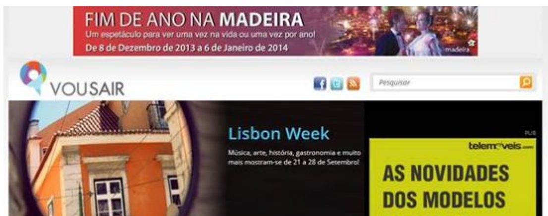
Figura 19: Banner da campanha “Madeira todo o Ano” usado em ambiente digital.

Em seguida apresentamos uma tabela onde podemos ver quais os elementos da Madeirensidade que foram mais destacados, e conseqüentemente divulgados, durante a semana de 7 a 13 de Outubro de 2013. Assim, concluímos que o romance, o fogo-de-artifício, o mar, a beleza paisagística, a beleza feminina e o turismo foram os elementos da Madeirensidade mais promovidos durante a semana em estudo.