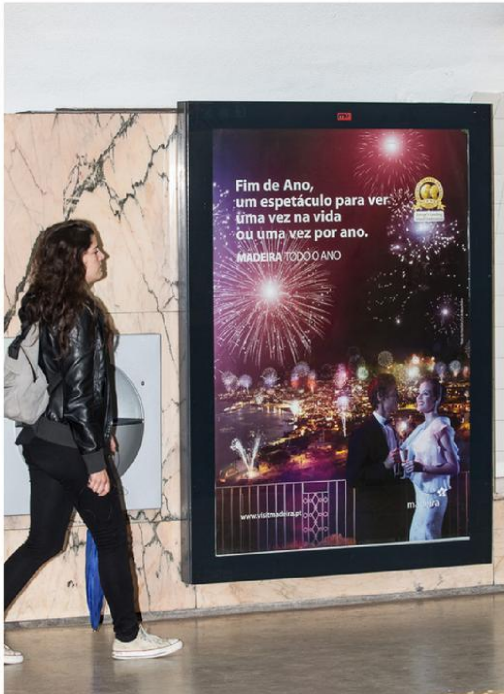
Figura 15: Mupi da campanha “Madeira todo o Ano”.