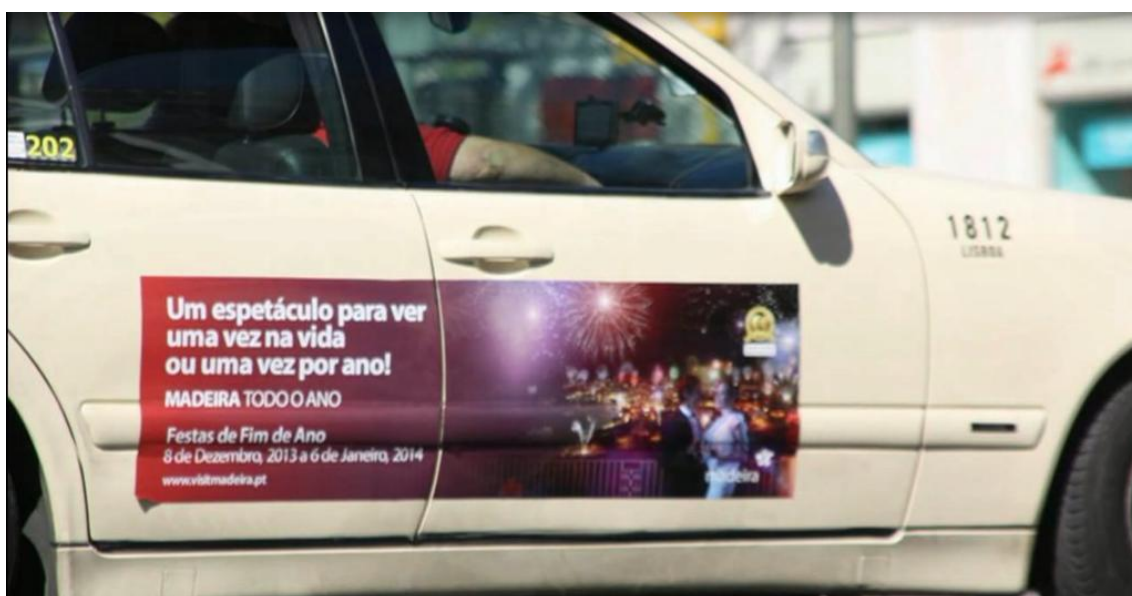
Figura 13: Inserção da campanha “Madeira todo o Ano” em táxi.