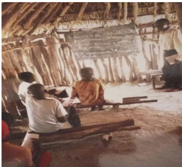
Alunos da 1ª classe numa sala de aula de pau-a-pique.