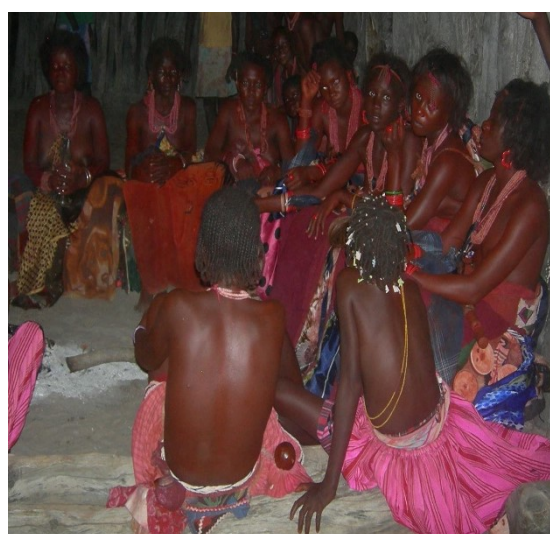
Ovafuko , sentadas no olupale num dos dias da Cerimônia de Efundula .