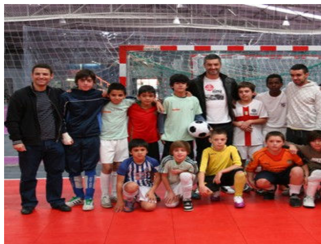
Figura 7: Atividade “Sport Raiz”