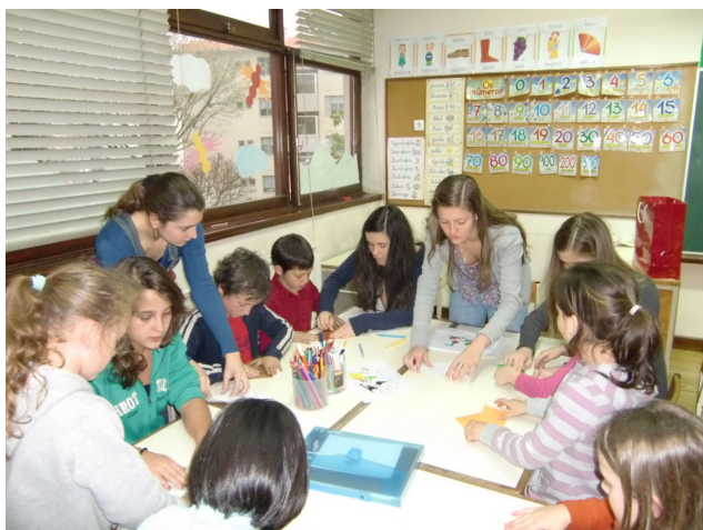
Figura 6: Atividade “Oficina de Expressões Plásticas”