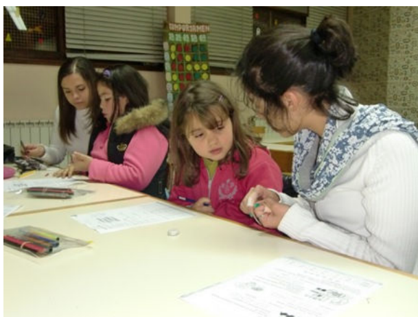
Figura 1: Atividade “Centro de Estudos”