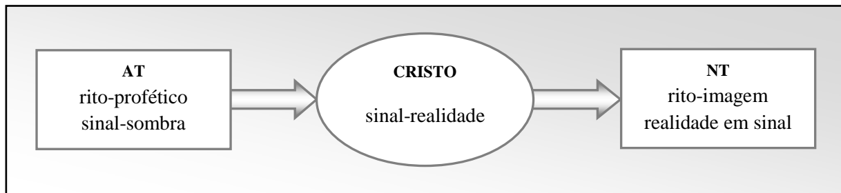
Figura 2 – Representação esquemática da relação entre os vários momentos da história da salvação.

A figura 2 apresenta de forma esquemática a relação que existe entre os vários momentos da história da salvação, à luz do que acabamos de expor: