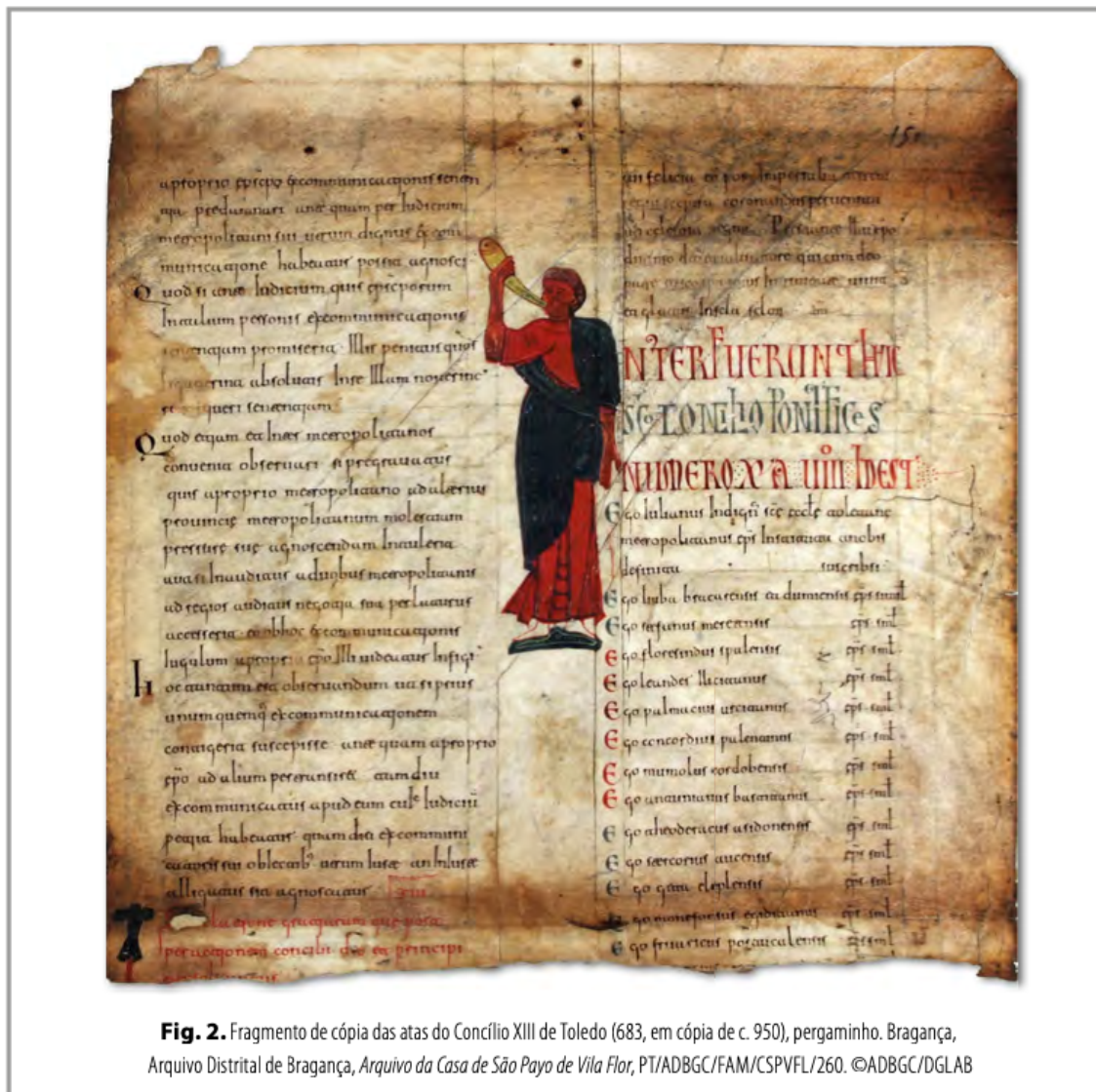
Fig. 2. Fragmento de cópia das atas do Concílio XIII de Toledo (683, em cópia de c. 950), pergaminho. Bragança, Arquivo Distrital de Bragança, Arquivo da Casa de São Payo de Vila Flor, PT/ADBGC/FAM/CSPVFL/260.

Durante a época visigótica, o episcopado da Lusitânia reforçou continuamente a identidade católica face à sociedade e à Igreja, o bispo foi-se tornando progressivamente o ministro da comunhão ad intra et ad extra . Ele simbolizou,