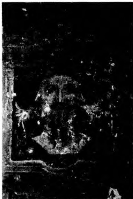
Fot. 6 - Capela de «Jano» (pormenor).