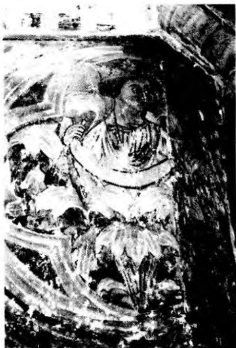
Fot. 4 - Capela dos Reis (pormenor).