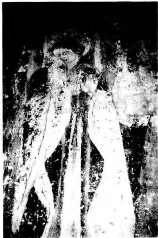
Fot. 2 - S. João Evangelista (fresco do «Calvário»).