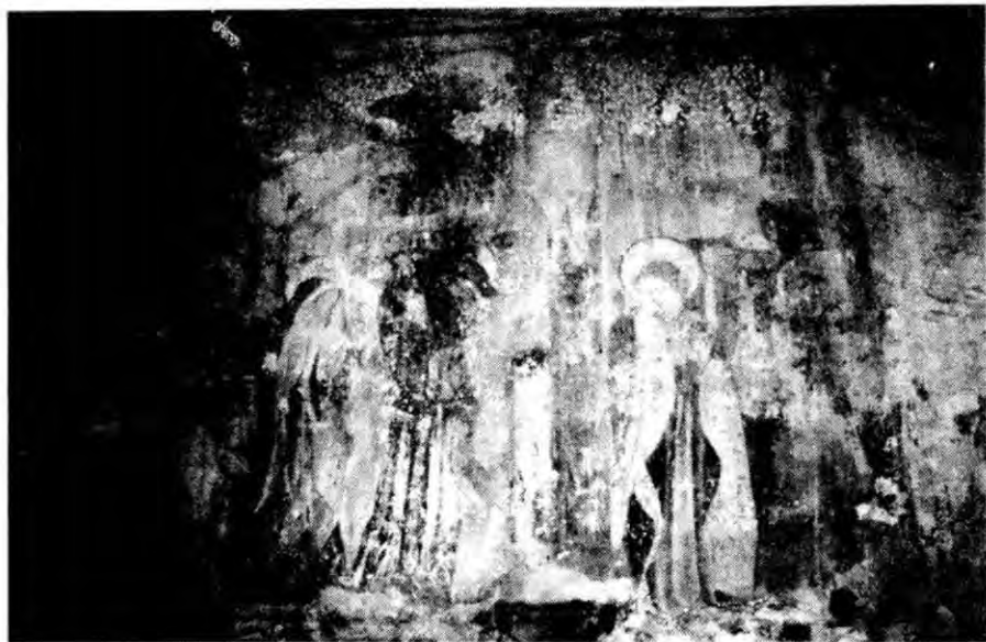
Fot. 1 - Fresco do «Calvário» (Capela-mor).