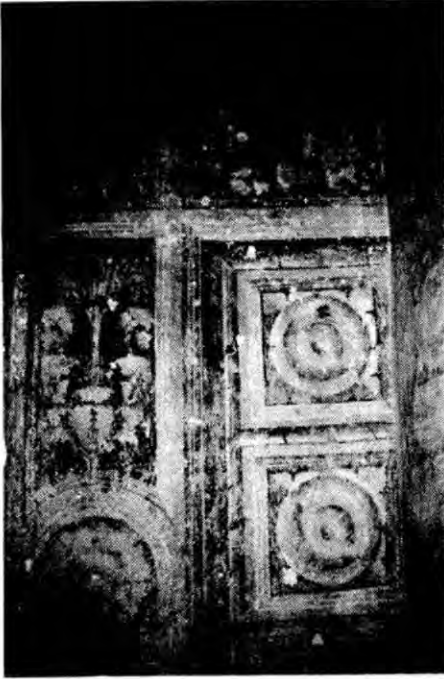
Fot. 7 - Capela dos escudos (pormenor).