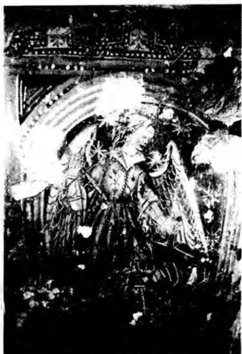
Fot. 3 - Capela do Arcanjo S. Miguel (pormenor).