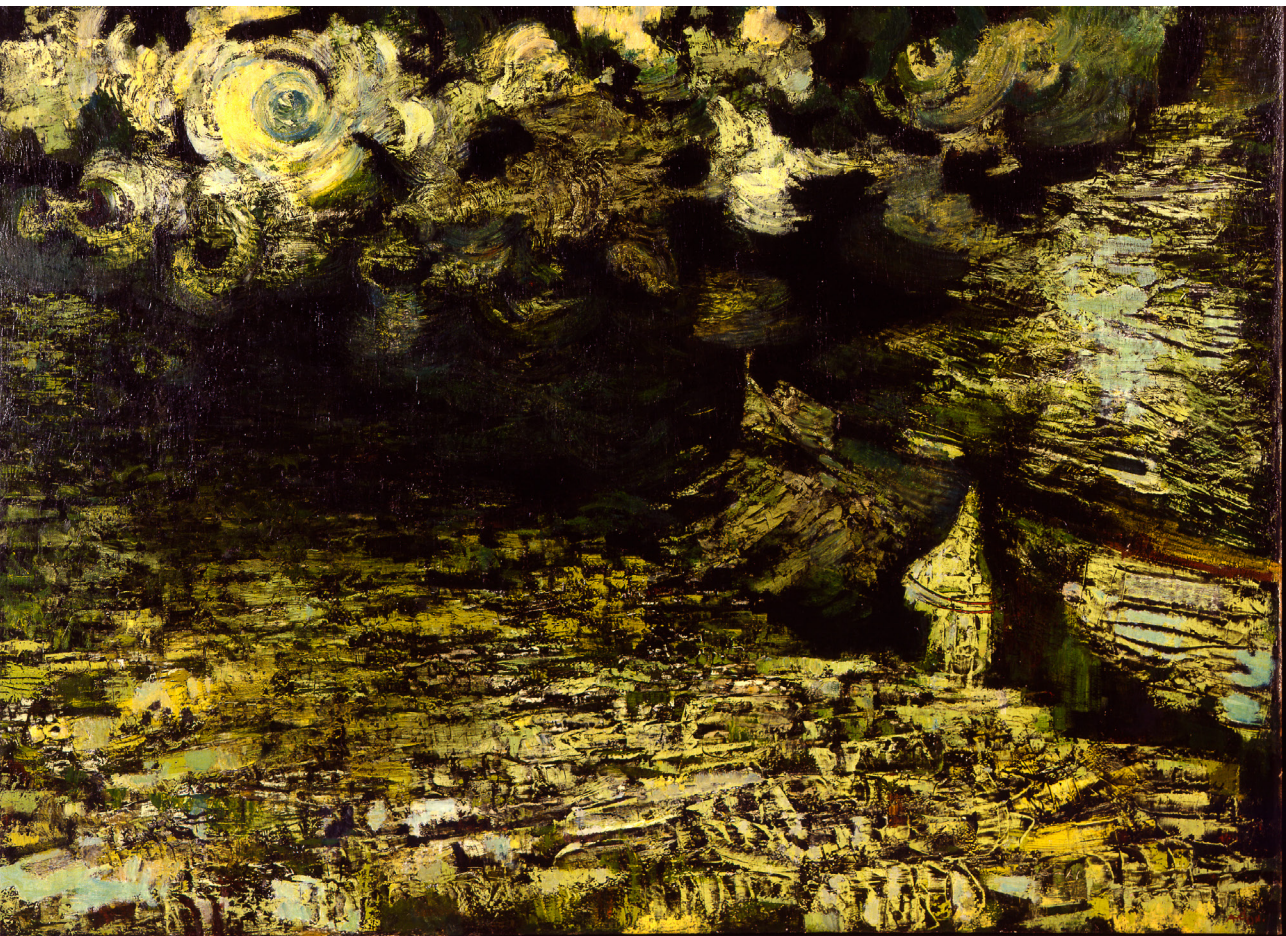
Mordecai Ardon, Ribeira de Kidron (נהל קדרון), 1942 Museu de Israel, Jerusalém - © Ardon Estate