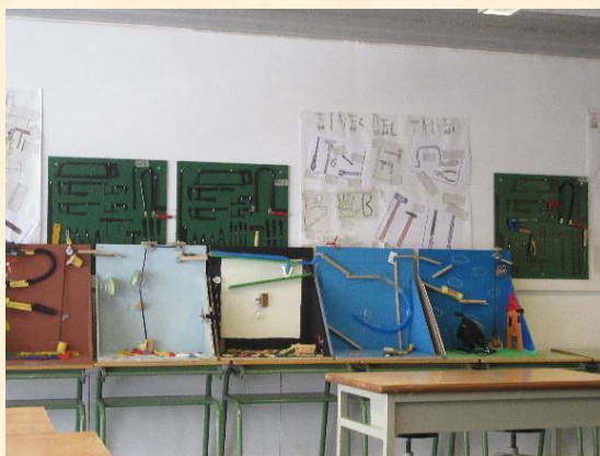
Figura 1 – Oficina de trabalho

O clima da escola parece ser positivo e promotor de aprendizagens. Relativamente aos espaços, pode dizer-se que as salas de aula são tendencialmente normais , destacando-se a existência de espaços destinados à manipulação, à criação e à construção, como é possível observar nas figuras 1 e 2.