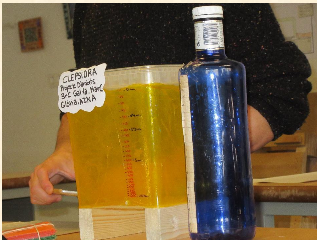
Figura 4: Clepsidra - Projeto de âmbito científico-tecnológico

Os projetos de âmbito são sempre desenvolvidos em grupos de cerca de 20 alunos, com dois professores da área do projeto simultaneamente em sala de aula.