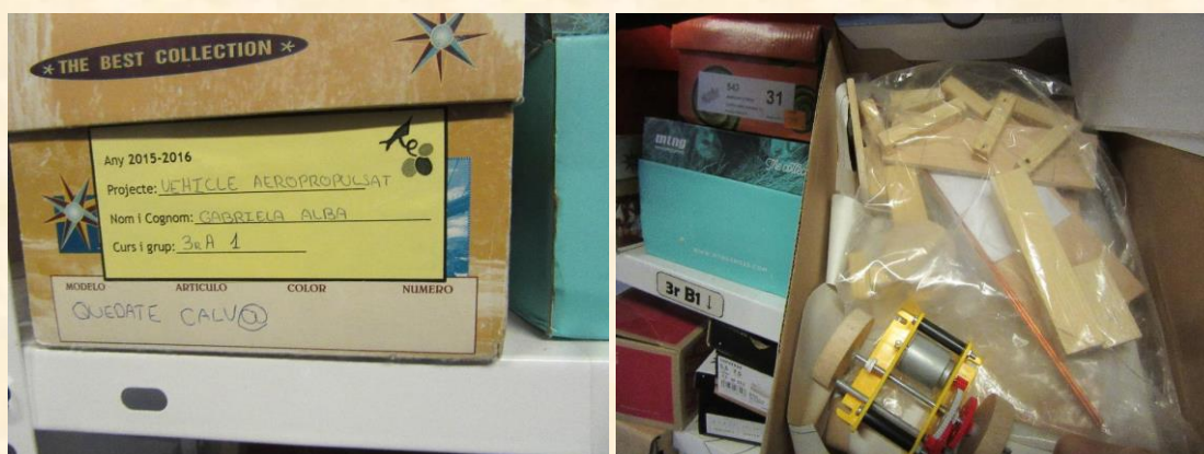
Figura 6: Projetos em curso

Os projetos transversais ocupam 20% da carga letiva anual dos alunos, desenvolvendo-se uma vez por período (a meio do período), ao longo de duas semanas. Em termos organizacionais, a particularidade destes projetos é a de serem desenvolvidos ao mesmo tempo por toda a escola, ou seja, durante as duas semanas selecionadas para o trabalho em projeto transversal deixam de funcionar os horários previamente estabelecidos e todos os alunos e professores do ESO trabalham todo o dia unicamente no projeto. Estes projetos são trabalhados em conjunto por todos os alunos de um mesmo ano de escolaridade (entre 60 a 90) com uma equipa de seis professores de áreas disciplinares diferentes.