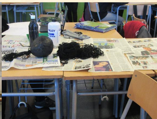
Figura 2 – Sala de aula onde os alunos trabalham em projetos