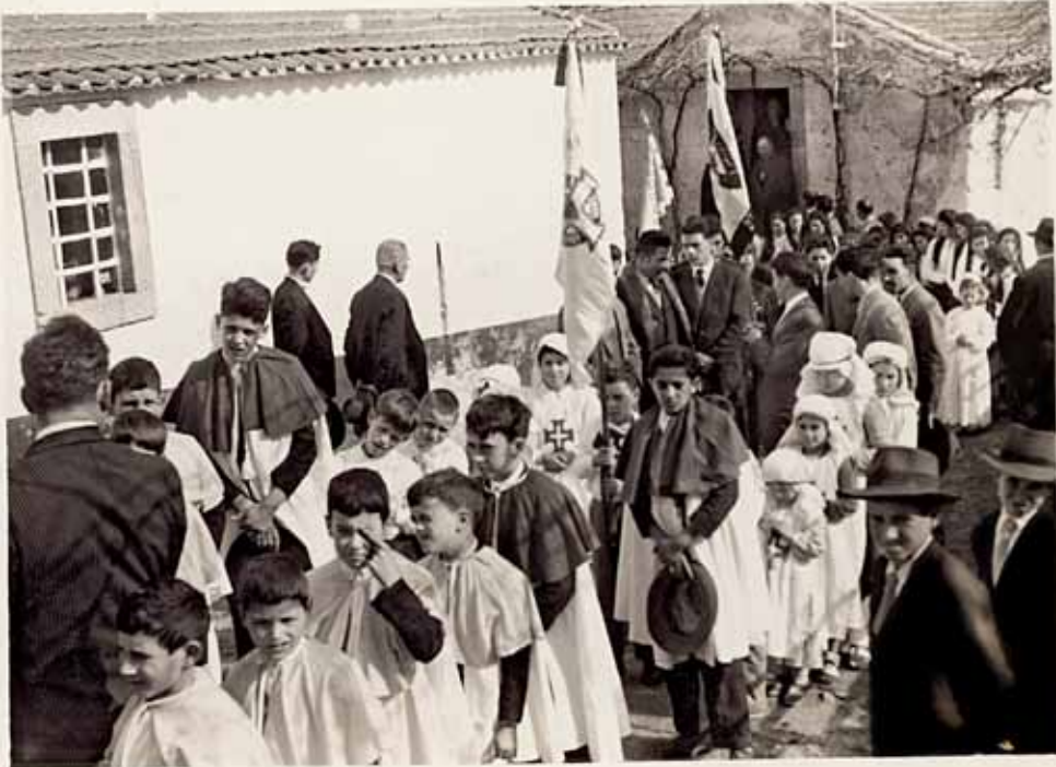
Procissão no adro da Igreja, com a antiga residência paroquial ao fundo. Meados do século XX