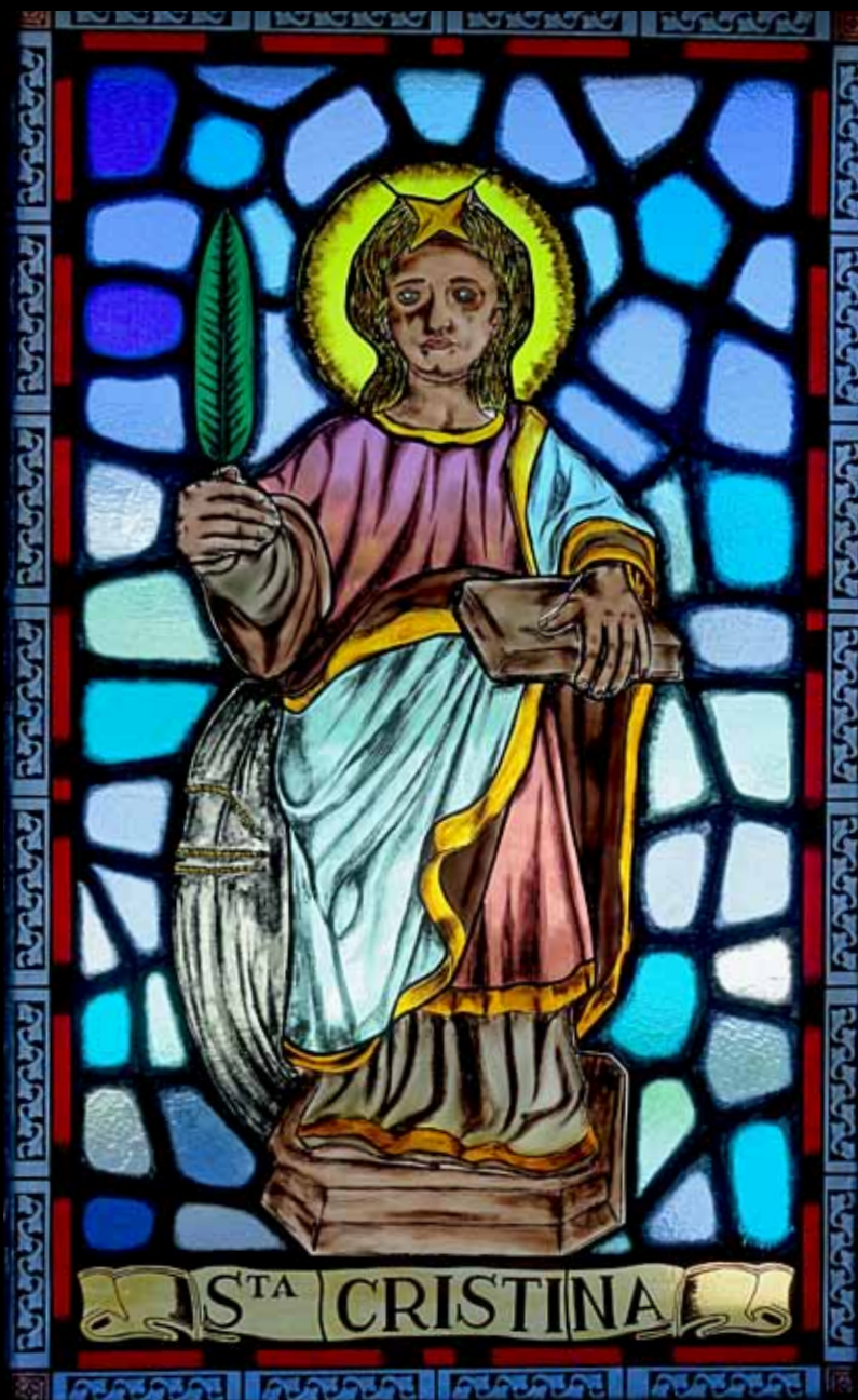
Imagem de Santa Cristina representada na janela do coro. Vitral.