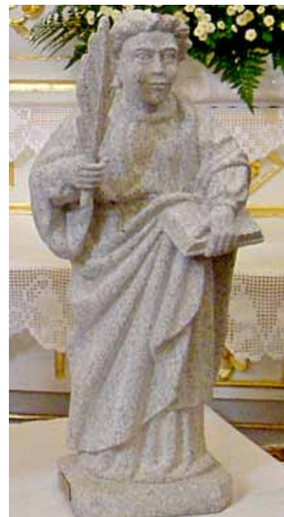
Imagem de Santa Cristina conservada no nicho da fachada principal. Granito.

Segundo a lenda, Santa Cristina suportou todos estes suplícios e morreu com apenas doze anos de idade.