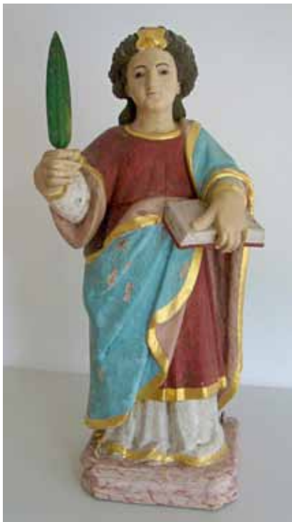
Imagem de Santa Cristina conservada no altar-mor (antes de restaurada). Madeira.

O orago da paróquia de Mansores é, desde as origens, Santa Cristina, cuja festa se celebra a 24 de Julho. Na igreja paroquial existem três imagens da padroeira: uma em madeira, no interior, uma em granito, no nicho da fachada principal, e uma outra representada no vitral dessa mesma fachada.