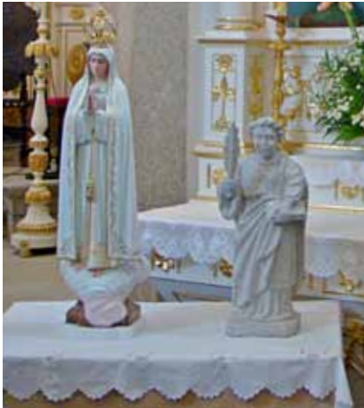
Imagens de Nossa Senhora de Fátima e de Santa Cristina