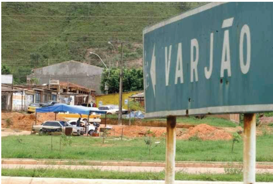
Figura 2: Vista da cidade de Varjão

Pode-se visualizar a história no link: https://youtu.be/qNFyiG7V8bk?t=143