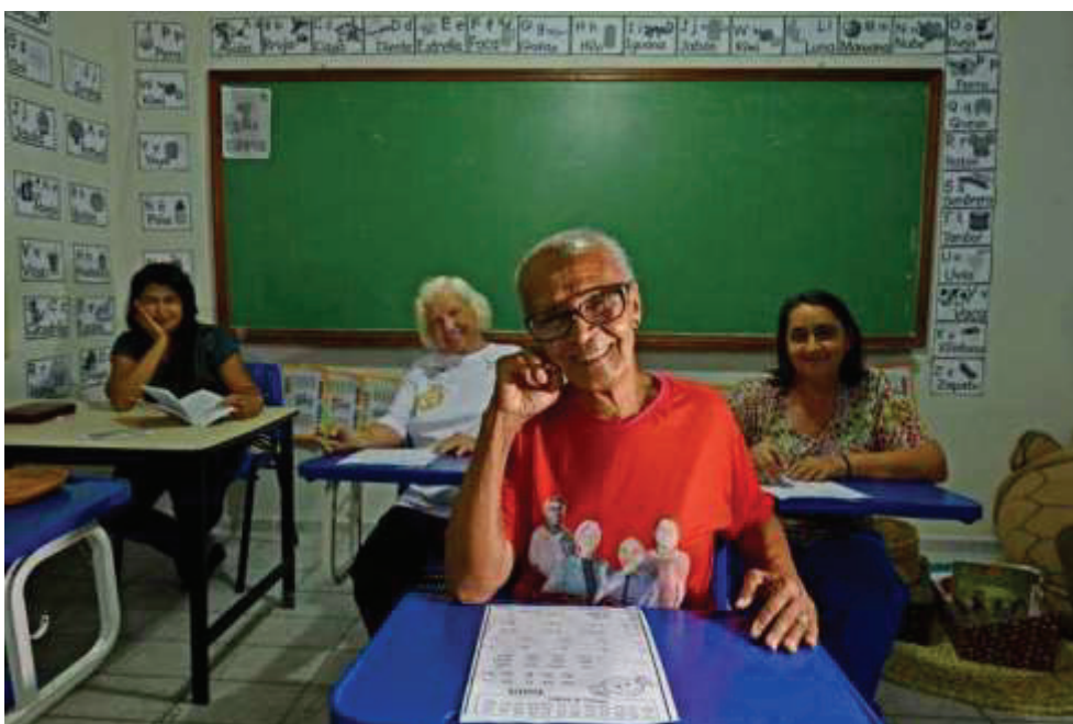
Figura 3: Sala de aula do projeto de alfabetização