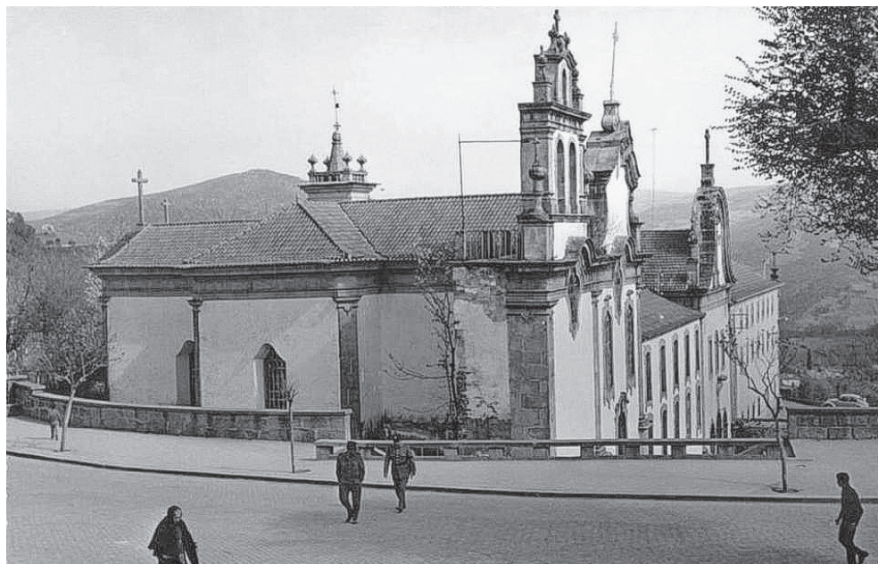
Fig. 5. Convento/Seminário dos Missionários Apostólicos de Vinhais (Fotografia cedida por Roberto Afonso).