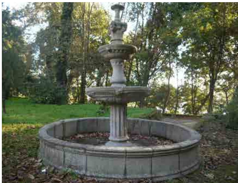
Figura 5 – Chafariz do claustro do mosteiro de S. Bento da Ave-maria (1528).