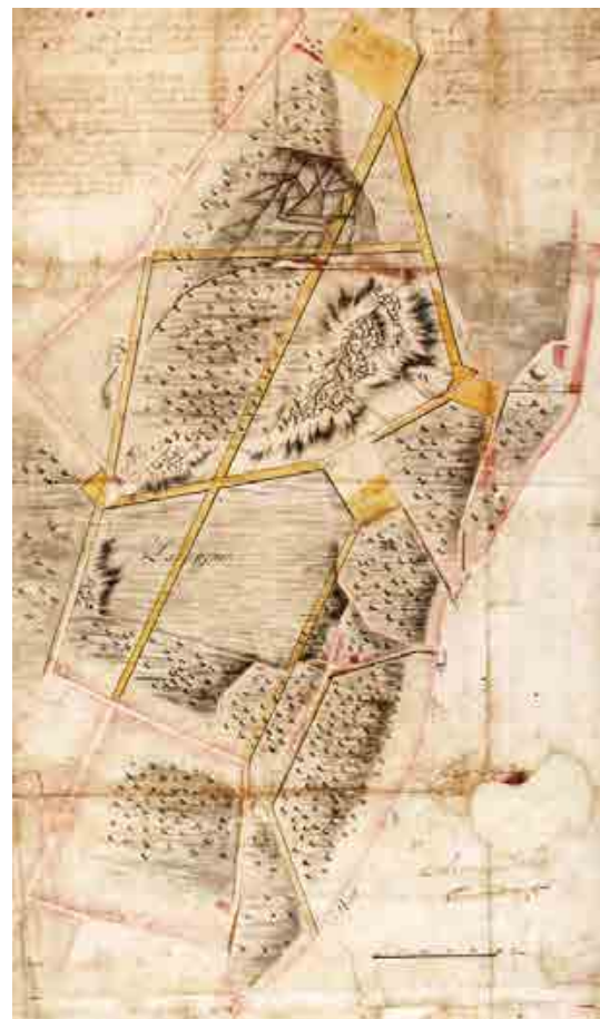
Figura 9 – Plano de Xavier do Rego para os Laranjais [1761] [AHMP D - CDT/A4 - 162] 1835 [AHMP, Col/A/ (1 - 2) im].

A razão da sua retirada prendeu-se com a implementação do plano encomendado ao inglês Barry Parker (1915), depois transformado por Marques da Silva, para a avenida dos Aliados, que previa a construção, nesse local, de um novo edifício camarário, iniciado em 1920, mas apenas definitivamente concluído em 1957 (Figura 11). O chafariz foi, por isso, de novo trasladado e depositado no jardim dos Serviços Municipalizados de Águas e Saneamento da rua Barão de Nova Sintra.