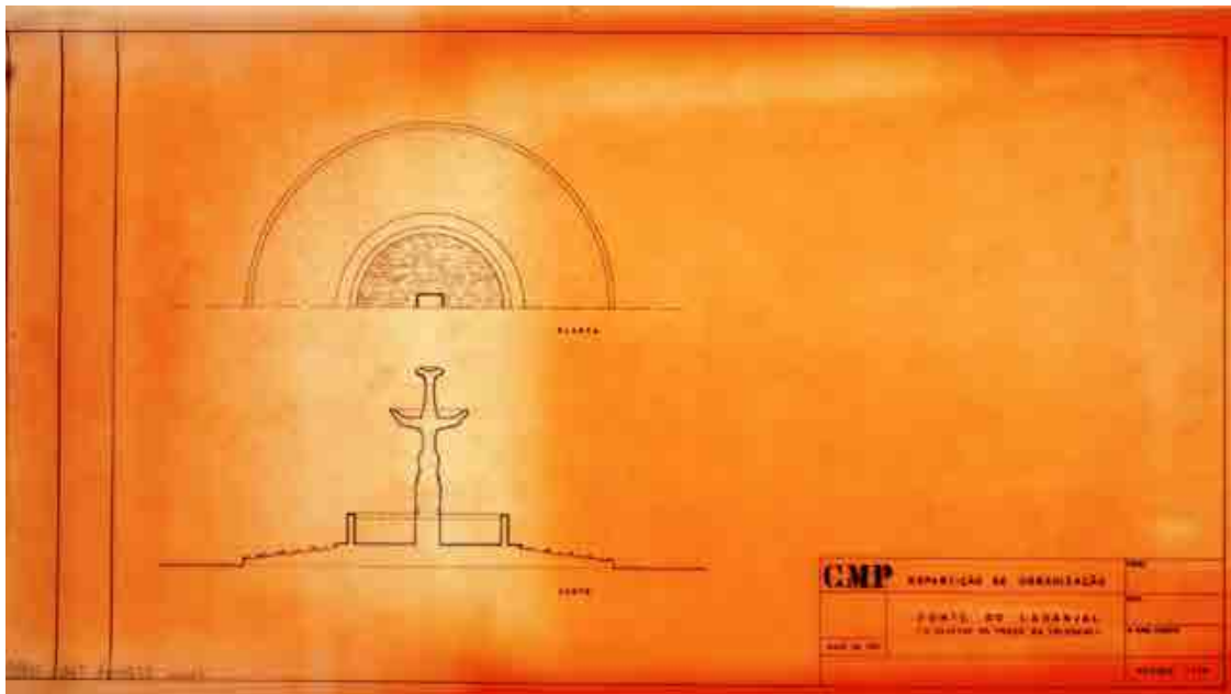
Figura 13 – Projecto para o chafariz de S. Domingos na Praça da Trindade.