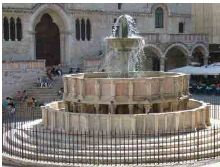
Figura 2 – Fontana Maggiore de Perugia.