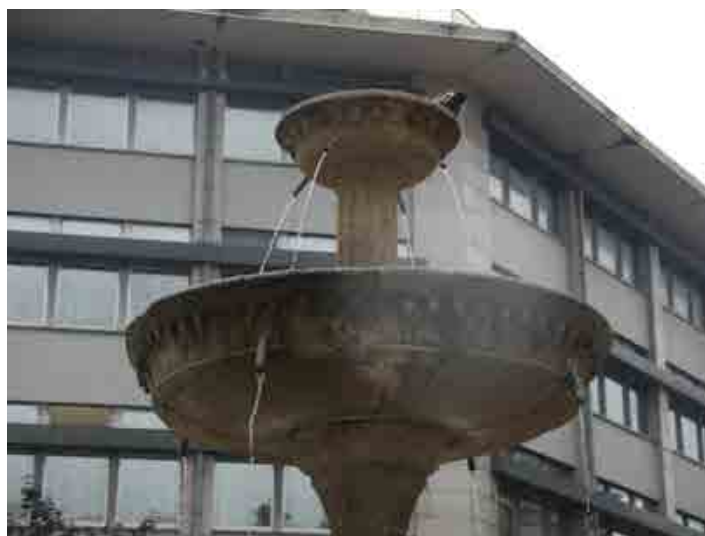
Figura 7 – Chafariz de S. Domingos – Pormenor da inscrição.

380 Não admira, portanto, que a Câmara tivesse recorrido a ele para erguer o chafariz de São Domingos (Figura 6). Atualmente na praça da Trindade é, como o de S. Bento da Ave-Maria, um chafariz com taças circulares, embora apenas em parte conserve os elementos originais: o tanque, a taça superior e os balaústres não aparentam ser já os quinhentistas, o que condiz com afirmação de Sousa Reis relativa à sua modificação quando foi trasladado da sua localização inicial em 1845 (REIS, 1984: 184). Porém, quer a base quadrangular com apainelados, no centro dos quais se esculpem páteras, idênticas às que Cremona colocou no claustro da Sé de Viseu (1528) e, também, semelhantes aos que exhibe a porta travessa da igreja da vizinha Misericórdia, denotam a pureza do desenho italiano. Este é ainda acentuado pela taça, com um friso de dentículos jónicos e uma inscrição latina gravada no bordo, hoje apenas parcialmente legível, de que sobressaem as palavras COMMVNI REIP VSV DICATVM , alusivas à utilização comunitária da fonte (Figura 7).