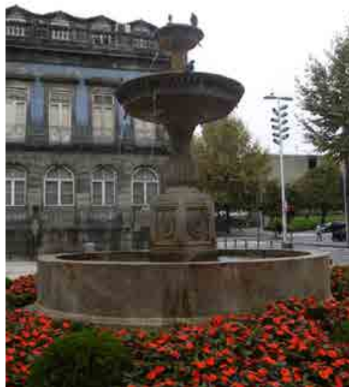
Figura 6 – Chafariz de S. Domingos (1544).

380 Não admira, portanto, que a Câmara tivesse recorrido a ele para erguer o chafariz de São Domingos (Figura 6). Atualmente na praça da Trindade é, como o de S. Bento da Ave-Maria, um chafariz com taças circulares, embora apenas em parte conserve os elementos originais: o tanque, a taça superior e os balaústres não aparentam ser já os quinhentistas, o que condiz com afirmação de Sousa Reis relativa à sua modificação quando foi trasladado da sua localização inicial em 1845 (REIS, 1984: 184). Porém, quer a base quadrangular com apainelados, no centro dos quais se esculpem páteras, idênticas às que Cremona colocou no claustro da Sé de Viseu (1528) e, também, semelhantes aos que exhibe a porta travessa da igreja da vizinha Misericórdia, denotam a pureza do desenho italiano. Este é ainda acentuado pela taça, com um friso de dentículos jónicos e uma inscrição latina gravada no bordo, hoje apenas parcialmente legível, de que sobressaem as palavras COMMVNI REIP VSV DICATVM , alusivas à utilização comunitária da fonte (Figura 7).