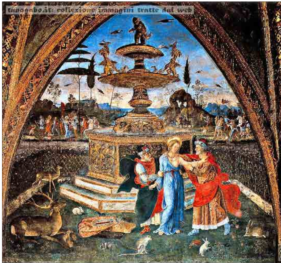
Figura 3 – Pinturicchio - Susana e os Velhos (1493-1495).