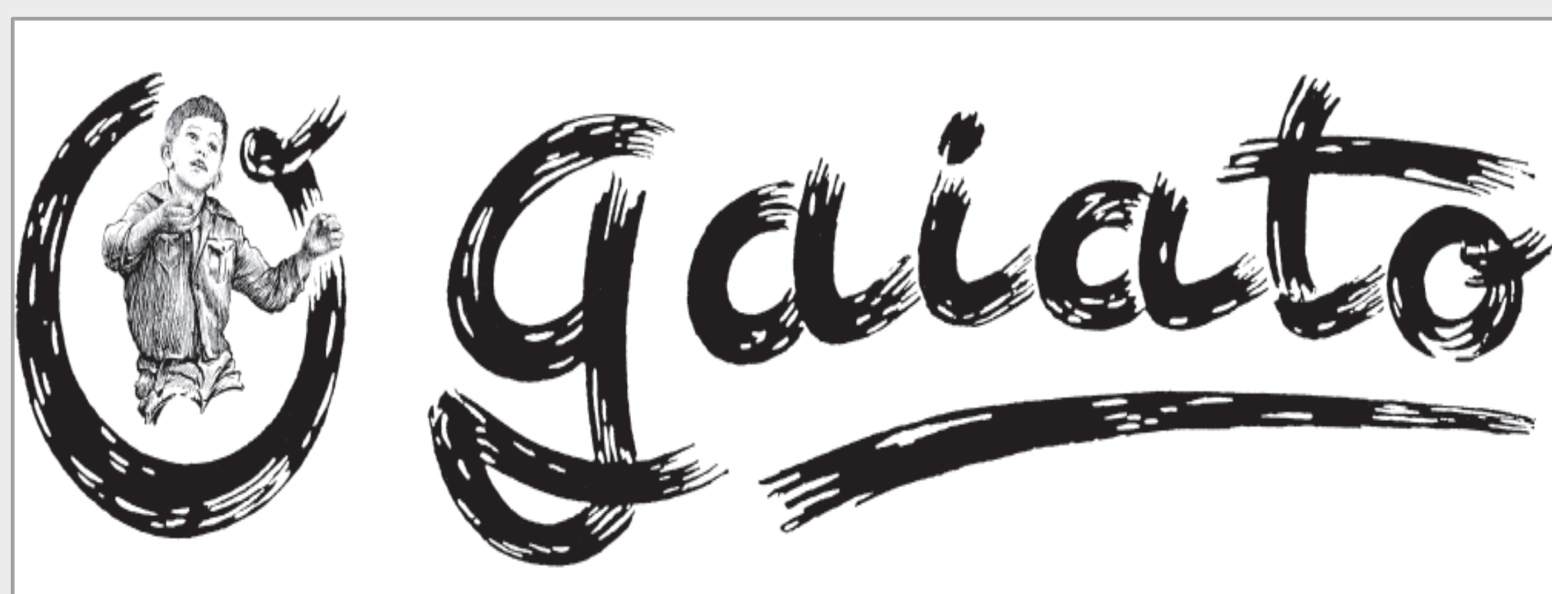
Créditos da imagem: Logotipo do jornal quinzenal “O Gaiato”, fundado por Padre Américo a 5 de março de 1944 e atualmente ainda em circulação

http://portal.cehr.ft.lisboa.ucp.pt/PadreAmerico/index.html )