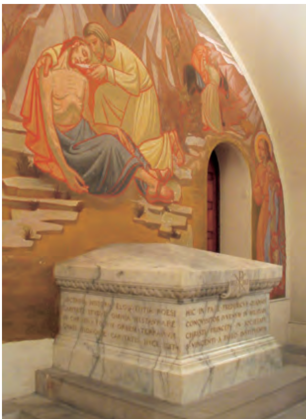
Túmulo de Frédéric Ozanam, em Paris.

O campo do debate cultural foi apenas o primeiro momento que visava fundamentar a validade do Cristianismo. A vivência quotidiana impulsionava Ozanam a tomar outra atitude. E é no âmbito deste desafio que se deve entender a gênese da SSVP. Para Ozanam, o Cristianismo deve demonstrar que é uma força civilizadora perante o próprio mundo. Consequentemente, tem que se desenvolver no contexto social existente.