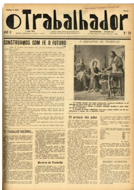
Folha do Jornal O trabalhador 1 de Julho de 1935, pág.2.

Encontram-se aqui em anexo os guiões sobre o Padre Abel Varzim, assim como, algumas imagens e notícias que serviram de apoio à concretização do trabalho de investigação e posterior construção da exposição Padre Abel Varzim: um ser livre que libertou os outros: