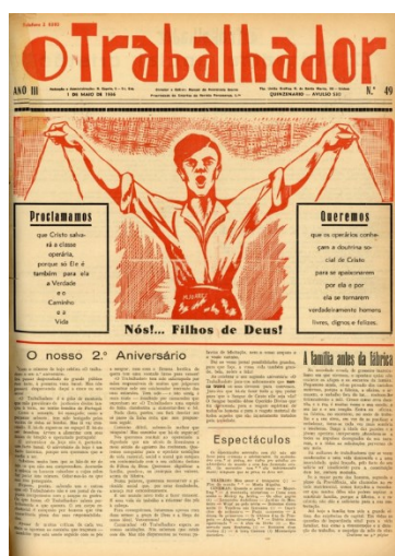
Página principal do jornal O trabalhador de 1 de Maio de 1935