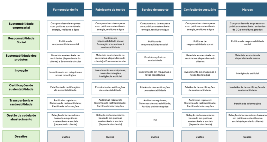
Figura 2: Diagrama de análise

sendo, contudo, exclusivo. Para cada categoria, encontra-se evidenciado a cinzento a abordagem que se diferencia das restantes, à exceção da secção dos Desafios, uma vez que todas as empresas salientaram o mesmo desafio como o principal.