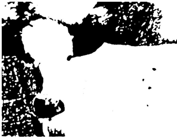
Fig. 1 (in Spitzer 2004: 61)

Consideremos a imagem a seguir. Se colocarmos a questão do que nela se vê, a resposta será algo difícil: é um aglomerado de pontos, em contraste com uma superfície branca, talvez se veja um contorno. Mas é uma imagem pouco clara.