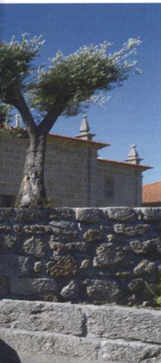
Tagilde (Vizela): lápide evocativa do primeiro tratado de aliança entre Portugal e Inglaterra

que os números dos cronistas não sejam condizentes, falamos de uma estimativa entre as 16 e as 28 galés e cocas de guerra, e as 24 a 30 naus menores. Em qualquer dos casos, uma armada suficiente para tomar e destruir Cádiz. Na realidade, a armada de Henrique, nessa altura, apresentava apenas 20 galés. Os navios portugueses eram um poderoso ativo para os ingleses.