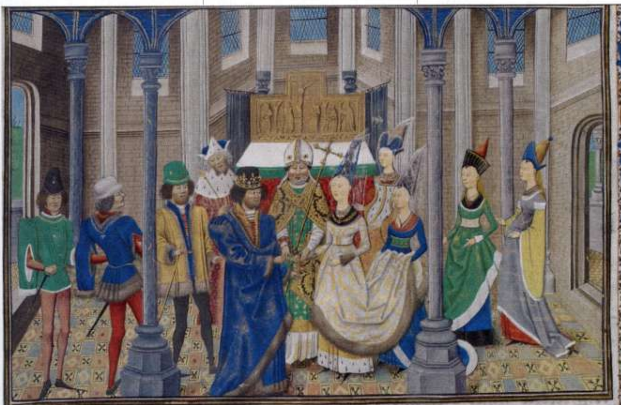
Et fait mention comment le roy Jehan de portingal espousa phelipe de landcastre fille au duc Jehan de landcastre sollempnelement en la cite de port en portingal. Chapitre. xxxiii.

João de Castela a coroa que o sobrinho lhe dera e que usara em Santiago de Compostela. Foi também então que recebeu o primeiro pagamento castelhano, transportado em 47 mulas carregadas de ouro. João de Gante e João de Castela nunca se encontraram pessoalmente.