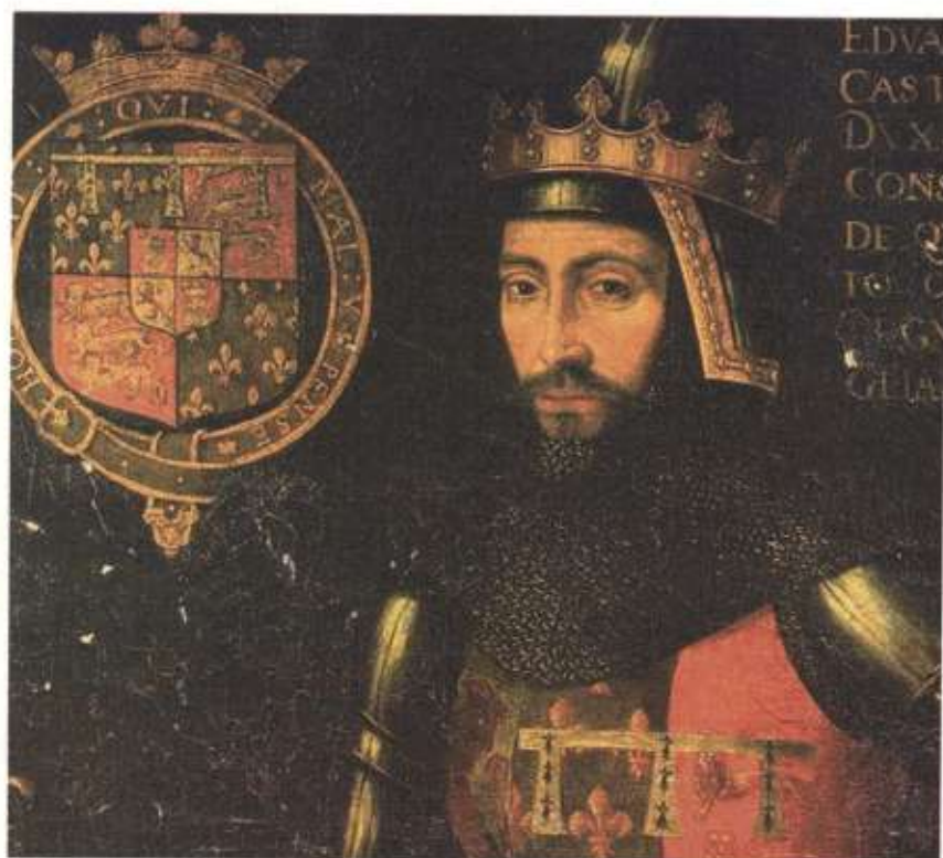
Retrato de Gante feito em finais do século XVI, talvez inspirado na efígie tumular do duque

Não foi só por herança que deteve imensos poder e influência, mas pela sua determinação e, também, pelo acaso. Quis ser rei mas nunca o foi, nem em Inglaterra nem em Leão e Castela, apesar de assim se ter intitulado, depois do segundo casamento com uma infanta castelhana. Por essa altura, interessou-se pelas políticas portuguesas. Acolheu em Londres João Fernandes Andeiro e negociou com D. Fernando e, depois, com D. João I um programa de alianças que viria a materializar-se no afamado, e ainda em vigor, Tratado de Windsor. Cunhou moeda na cidade do Porto, exibindo o seu nome como rei de Castela, e empreendeu ao lado do exército português uma invasão de Leão, chegando a disputar a chefia militar com Nuno Álvares Pereira.