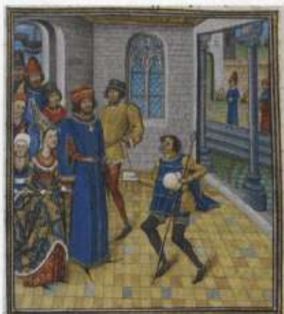
Et parte de la venue du duc de landcastre au port de la quenouille - en milice. xxxvj.

Representação do momento em que um mensageiro de D. João I, novo rei de Portugal, entrega carta a João de Gante