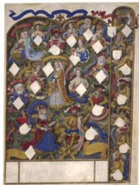
O duque de Lencastre, em baixo, ao centro, figura central de uma complexa genealogia de poder

E sta é a história de João de Gante (1340-1399), John of Gaunt, terceiro filho do rei inglês Eduardo III a chegar à idade adulta. Referido assim, pouco dirá à generalidade dos portugueses, mas a familiaridade será maior se o referenciarmos como duque de Lencastre (Lancaster). Lencastre já é nome que surge nos nossos compêndios, por via da filha mais velha deste homem, Filipa, mulher de D. João I, de cujo ventre ramificou a segunda dinastia reinante de Portugal. João de Gante é, afinal, decisivo no caminho português: avô da geração que Camões apodou de "Íncrita", foi também obreiro da mais antiga aliança que se conhece.