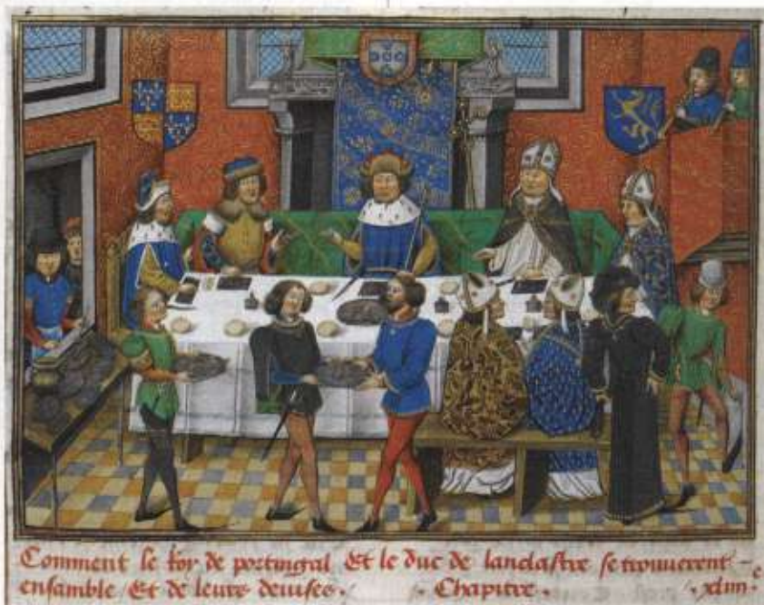
Comment le for de portugal Et le duc de landcastre se trouuerent ensemble Et de leurs deuise. Chapitre. xliij.

Representação do momento em que um mensageiro de D. João I, novo rei de Portugal, entrega carta a João de Gante