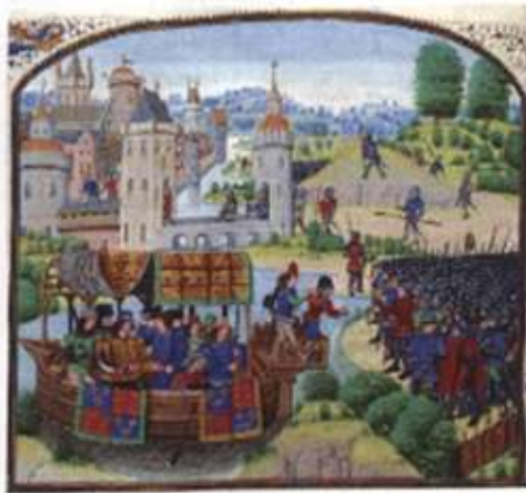
Ricardo II a negociar com os revoltosos de 1381

Logo em 15 de junho começaram as retaliações. Robert Knolles, implacável, foi chamado para tomar conta da situação em Londres. A 30 de junho, o rei