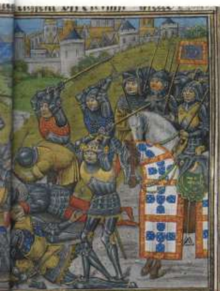
Aljubarrota: miniatura mostrando como as tropas luso-inglesas venceram as castelhanas