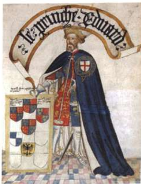
Eduardo de Woodstock, o Príncipe Negro

Gante ficou muito próximo deste clérigo, tornando-se o seu principal protetor. Havia ali uma gestão de interesses mútuos: de natureza política para Gante e, em troca, segurança e influência para Wycliffe. Certo é que, assim que Wycliffe, inevitavelmente, começou a ser acusado de heresia, já na década de 1370, o duque foi arrastado. Mas Gante nunca o abandonou. Quando o religioso foi preso e obrigado a responder perante o bispo de Londres, esteve lá, com alto custo pessoal, para o defender. E foi sob a proteção do duque que Wycliffe morreu, em 1384. Só em 1415, 16 anos após a morte de João de Gante, é que a Igreja Católica condenou formalmente Wycliffe, exumando as ossadas e queimando-as em ato público.