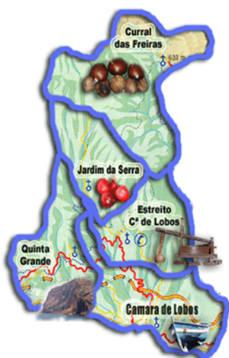
Figura 3- Mapa do Concelho de Câmara de Lobos

"(...) uma rocha delgada à maneira de ponta baixa, que entra muito no mar; e entre esta rocha e outra fica um braço de mar em remanso, onde a natureza fez uma grande lapa, ao modo de câmara de pedra e rocha viva. Aqui se meteram com os batéis e acharam tantos lobos marinhos, que era espanto e não foi pequeno refresco e passatempo para a gente; porque mataram muitos deles e tiveram na matança muito prazer e festa, o capitão João Gonçalves deu a este remanso Câmara de Lobos". 58