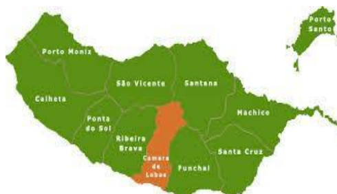
Figura 2 - Mapa da Ilha da Madeira

Câmara de Lobos é um dos onze concelhos do arquipélago da Madeira, limitado pelos concelhos do Funchal, Ribeira Brava, São Vicente e Santana.