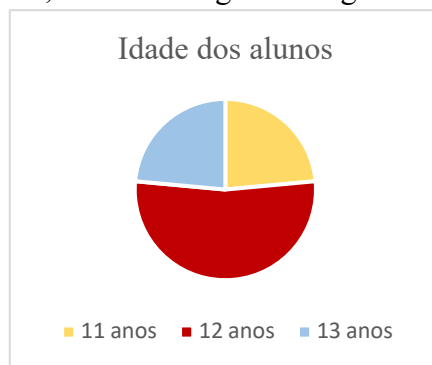
Gráfico 1- Idade dos Alunos da turma do 7.º B

Neste sentido, verificámos que os alunos se situavam na faixa etária entre os onze e os treze anos de idade, conforme o gráfico seguinte.