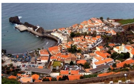
Figura 4 - Baía de Câmara de Lobos

É de salientar que a freguesia de Câmara de Lobos, sede de concelho, à qual pertence a Escola Básica dos 2º e 3º ciclos da Torre, é a que apresenta maior densidade populacional, integrando dois bairros sociais (o da Torre e o do Espírito Santo e Calçada) e seis complexos habitacionais - Quinta do Leme; Serrado do Mar, Torre, Ribeiro Real, Alecrim e Nova Cidade.