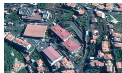
Figura 5 - Vista Aérea da Escola Básica dos 2.º e 3.º Ciclos da Torre

A sua construção iniciou-se em 1992, tendo sido inaugurada no dia 5 de outubro de 1993. É constituída por 3 edifícios: bloco principal, bloco de serviços, pavilhão gimnodesportivo e ainda um polidesportivo exterior. De sublinhar que, a partir de 2004, este último espaço foi transformado num pavilhão gimnodesportivo, cedido ao Centro Social e Desportivo de Câmara de Lobos.