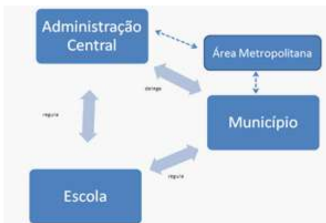
Imagem 1. Fluxos principais entre os intervenientes

descrevemos no esquema da Imagem 1 sendo de realçar que os fluxos/tensões principais foram considerados equitativos: