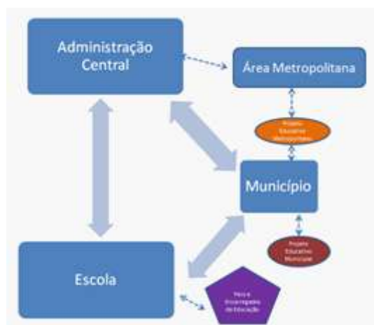
Imagem 3. Fluxos principais e secundários entre os intervenientes

Também se tornou evidente que os fluxos de influência existentes e que no ponto de partida foram considerados equitativos não o têm sido de facto, continuando a ser perceptível a preponderância da Administração Central neste processo territorialização da ação política ao nível educativo.