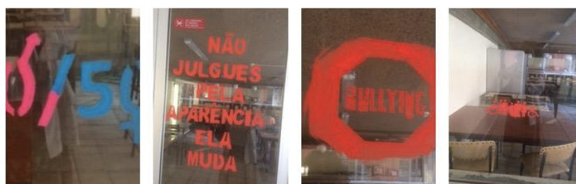
Imagem 5 – Pela Escola

Estes cartazes estiveram expostos no dia da Comunidade Educativa, dia 25 de maio de 2019, para toda a comunidade escolar.