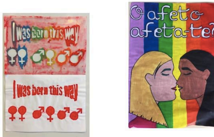
Imagem 3- Stencil e cartaz Bullying