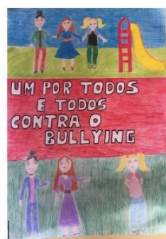
Imagem 2- Stencil e cartaz Bullying