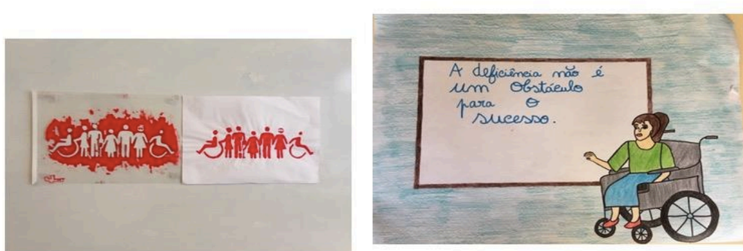
Imagem 4 - Stencil e cartaz Bullying