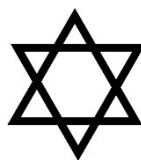
Estrela de David

8. Dentro do Judaísmo existem vários grupos, tendo cada um deles uma visão sobre o que devem seguir. Refere o nome de cada um desses grupos (p. 61).