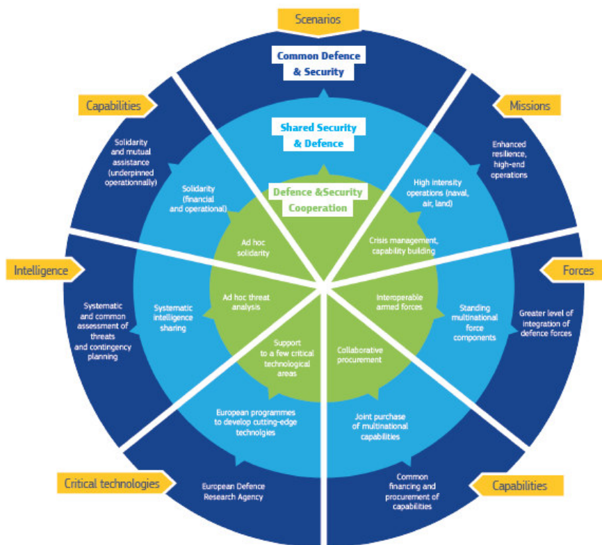
Figure 6: The Elements of a European Security and Defence Union

A Reflexão apresenta a seguir três cenários de evolução. Os cenários representam uma abordagem sequencialmente mais integrativa e, de acordo com o texto, os blocos descritivos dos diferentes cenários não são exaustivos nem mutuamente exclusivos. Eles destacam diferentes elementos de diferentes níveis de ambição para a União de Segurança e Defesa, em termos de solidariedade, operações, capacidades, indústria e uso de recursos financeiros.