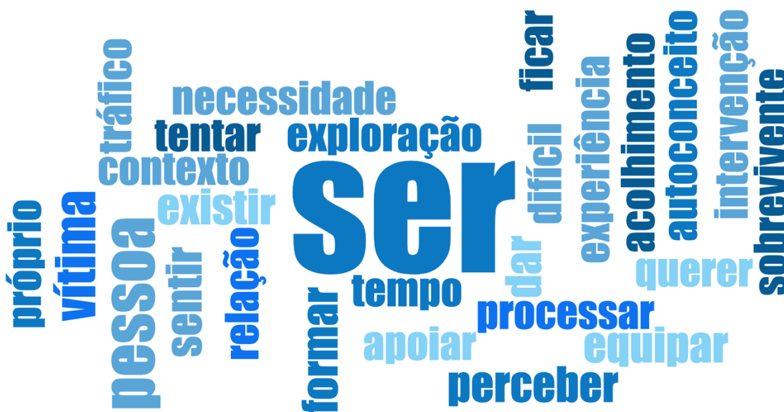
Figura 2. Nuvem de palavras recorrentes nas 14 entrevistas

as pessoas para possíveis situações de exploração, protegendo-as de ingressarem neste contexto, e capacitando-as para conseguirem sinalizar e identificar situações semelhantes. Por último, destaca-se o tempo, que, aliado às ações interventivas e dependente do sucesso e eficácia das mesmas, permite que as vivências sejam devidamente integradas e processadas, permitindo ao sobrevivente reerguer-se, integrar-se novamente na sociedade, redescobrir-se e alcançar uma vida saudável e digna.